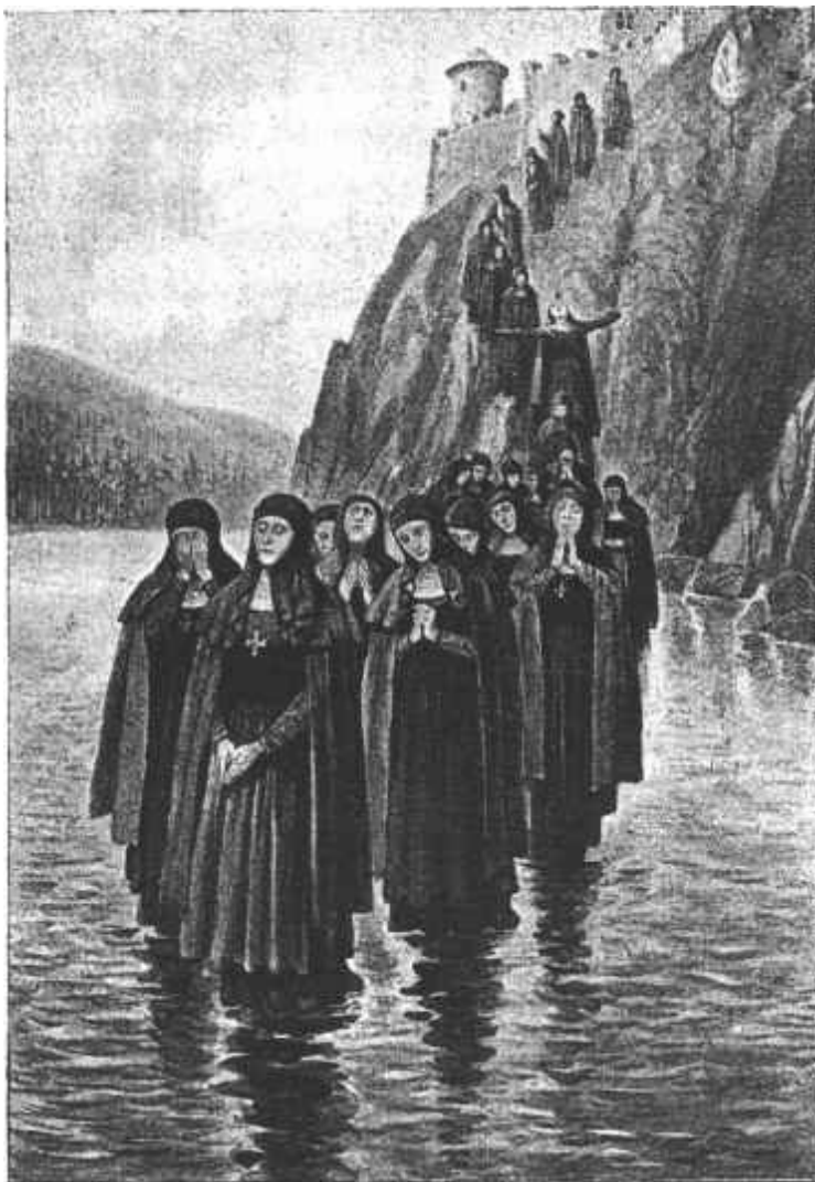
Průvod kvílících jeptišek po hradní skále k řece Lužnici.

Nejbližší neděli, mnohem dříve než sezváněno bylo na „malou“, blížili se malšičtí chasníci k temným stínům Příběnických zádumčivých hvozďů.