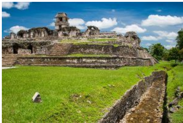
Palác v Palenque vlevo s akvaduktem vpravo

do chrámu (po trase vnitřního schodiště), někteří navrhli, že kanál poskytoval zapadajícímu slunci cestu přímo k Pakalovým ostatkům.