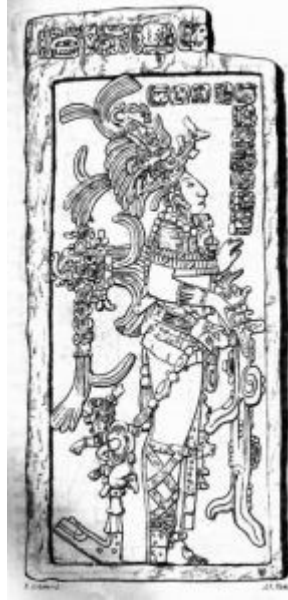
Král Chan Bahlum II. z Palenque v lednu 690