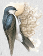
jířička obecná 35