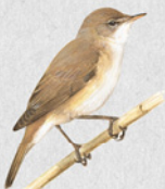
rákosník obecný 33