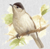
pěnice černohlavá 29