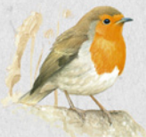
červenka obecná 28

Na prvních a posledních stránkách knihy najdeš přehled všech popsaných ptáků.