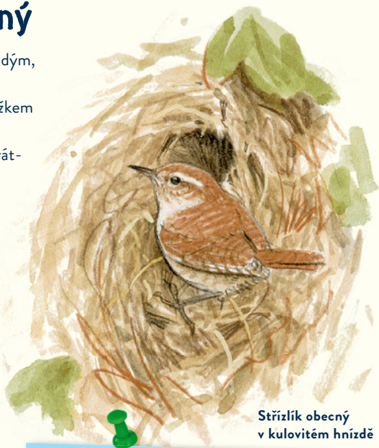
Střízlík obecný v kulovitěm hnízdě

Střízlík obecný žije při zemi v lesním podrostu, v parcích i zahradách, s oblibou se zdržuje také poblíž vody. V hustých křovinách pátrá po drobném hmyzu a pavoucích, aby je mohl sezobnout. V zimě také navštěvuje krmítka.