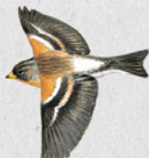
pěnkava jikavec 38