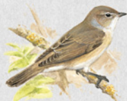
pěnice slavíková 30