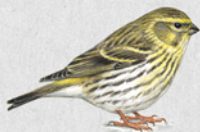
zvonohlík zahradní 36