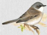
pěnice pokřovní 31