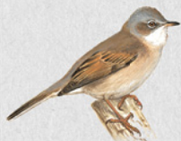
pěnice hnědokřídla 32