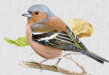
pěnkava obecná 39