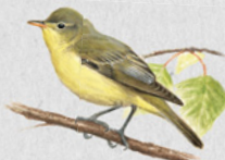
sedmihlásek hajní 34