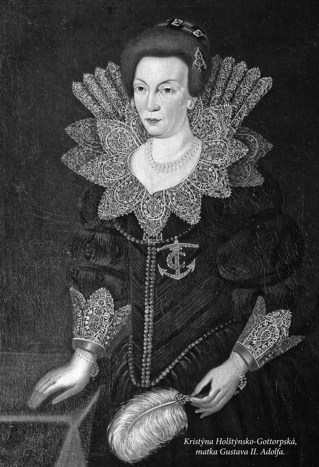
Kristýna Holštýnsko-Gottorpská, matka Gustava II. Adolfa.