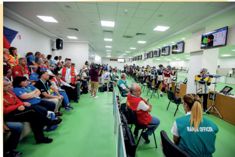
Interiér deaflympijské střelnice v Bafře.

Než odjel do Turecka na svoji třetí deaflympiádu, ověřil si, jak může být sport nevyzpytatelný. Vůbec se mu nedařilo na historicky prvním mistrovství světa neslyšících. I proto tak intenzivně