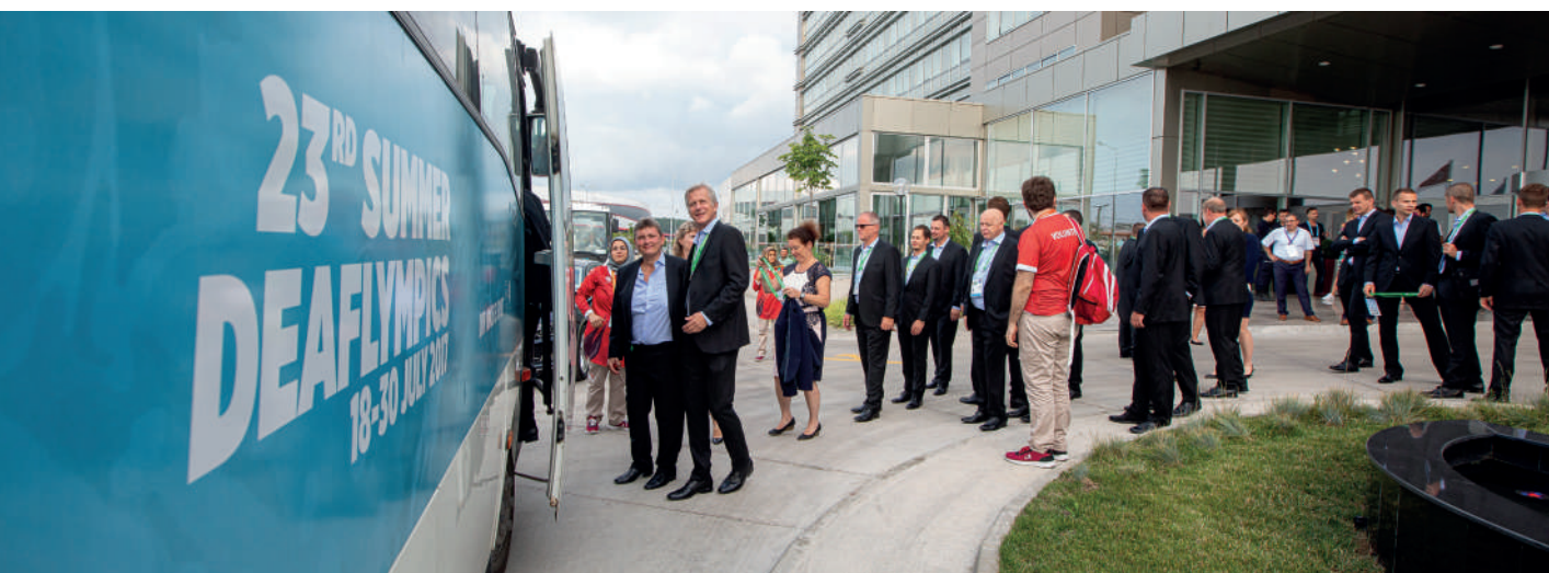
Před odjezdem na slavnostní zahájení z hotelu Park Inn by Radisson.

dvaceti disciplín deaflympijského programu. Nejbližší to od továrny na měď bylo na tenisové kurty. Potom k atletickému stadionu, ještě o kus dál k hale, v níž rozbil hlavní stan stolní tenis a bowling, a dalšího půl kilometru za ní, přímo u břehu Černého moře, se hrál plážový volejbal. Naopak za orientačními běžci, cyklisty, a spor-