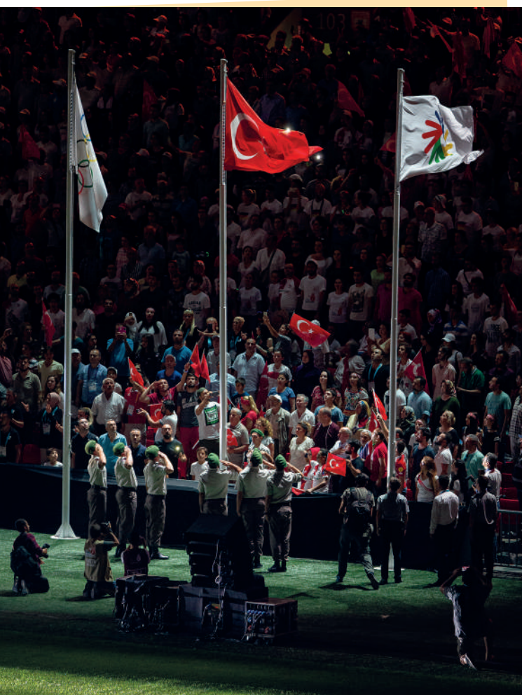
Čestná stráž vzdává před zraky diváků hold deaflympijské i turecké zástavě.

tady, sportovci zbytečně ztratili čas, který mohli věnovat aklimatizaci nebo tréninku, a podruhé nás sem nikdo nedostane! Nakonec se to vyřešilo. Akreditace se rozhoupaly na provázcích kolem krku, a další den se mohlo vyrazit na jinou obvyklou proceduru. Zahajovací ceremoniál.