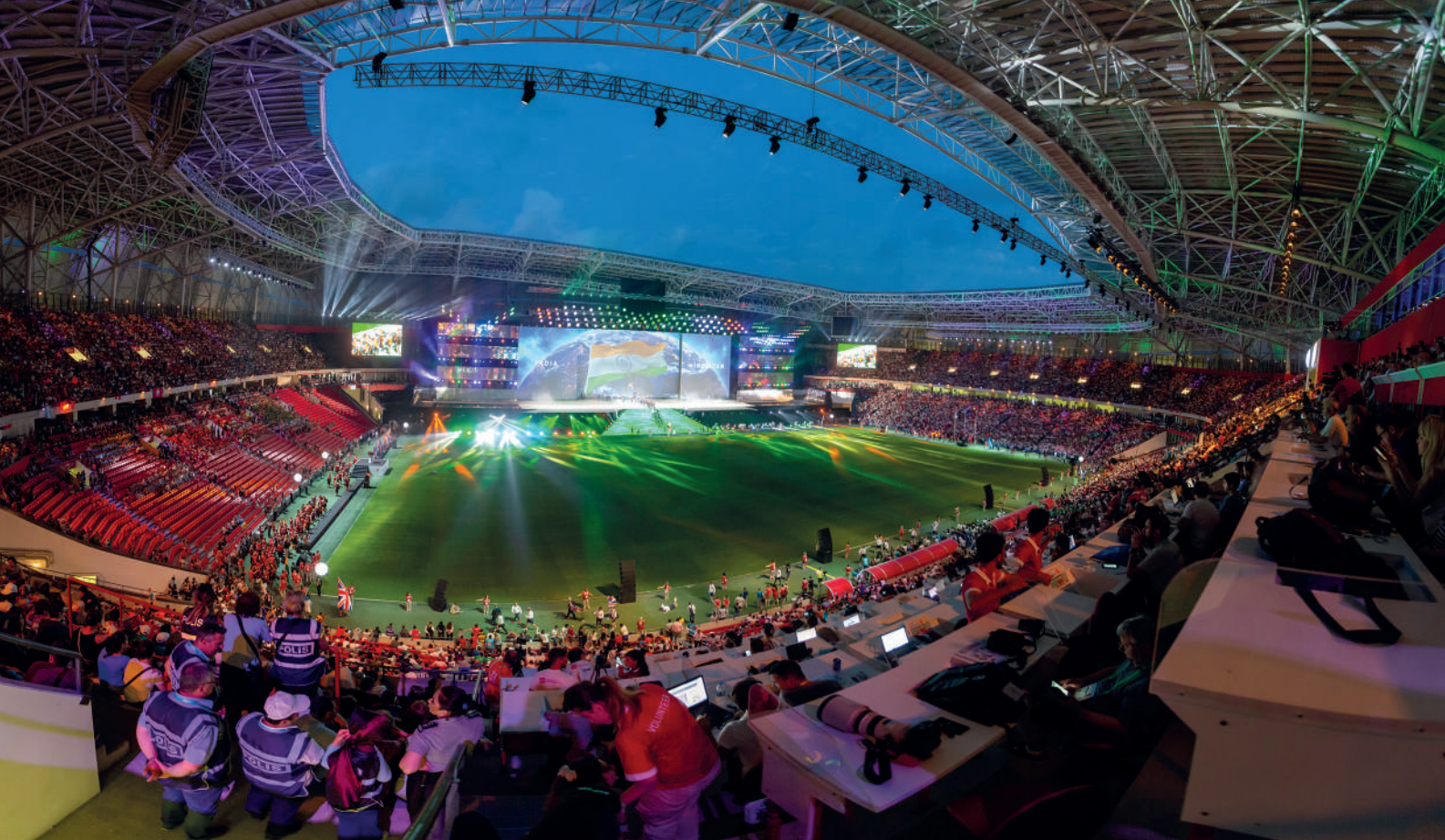
Panorama Yeni Samsun Stadium během zahajovacího ceremoniálu.