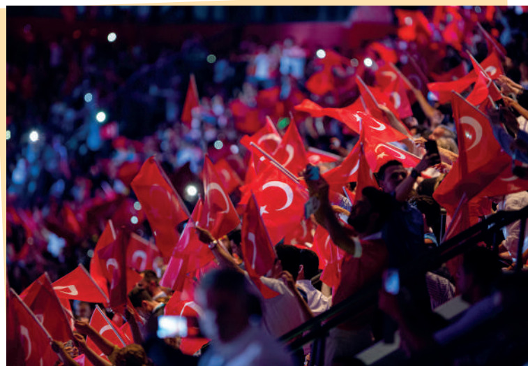
Les v ochozech nikoliv jehličnatý, ale červených vlajek s bílou pěticí hvězdou a půlměsícem.

Až poté se rozjela opravdová show, velkolepá, kdy se na pódiu v historických krojích či oblecích, občas s tureckými šavlemi, vystřídal několik skupin tanečníků, každá čítající 100 až 150 mužů či žen. Za jejich zády se promítaly úchvatné obrazy, jež byly v první řadě poctou kdysi mocné Osmanské říši a významným osobnostem turecké historie, té vzdálené i moderní, v níž nechyběly hrdým publikem hlasitě kvitované nacionalistické odkazy na prvního prezidenta Atatürka (zasloužil se o nezávislost Turecka) a současného prezidenta Erdogana. Prezentace se dočkalo rovněž dějiště her. Samsun. Bezmála čtyřhodinový program, pojetím i délkou srovnatelný s ceremoniály zahájení letních olympiád, uzavřel koncert současné pěvecké hvězdy jménem Murat Boz a ohňostroj. Vstup na zahájení i doprava na něj a zpět do města byly pro diváky zdarma.