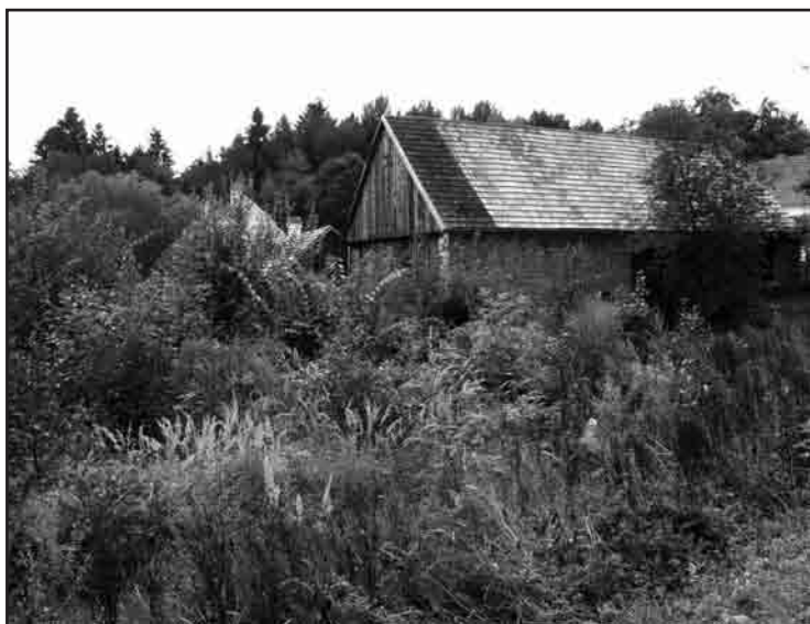
Stodola v Maříži. Intenzivní pocit krajiny, v níž jsme prožili mnoho generací.