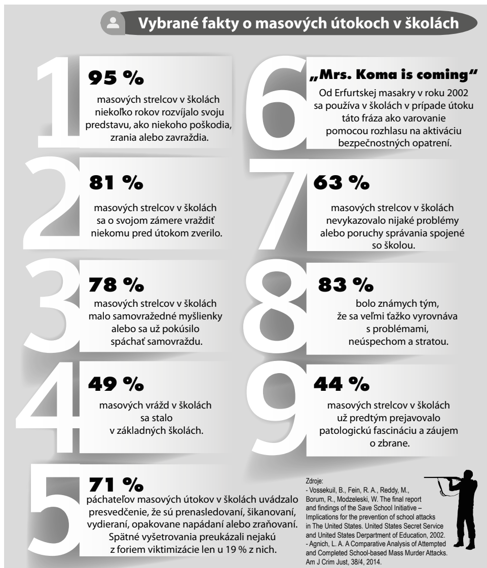
Obr. 2 Vybrané fakty o masových útokoch v školách

napríklad vrátiť k sériovým činom, ktoré majú zásadne odlišný charakter, niekedy aj mierne iný motív a stvárnenie. Ich zadržanie a psychologické profilovanie je zďaleka najnáročnejšie, nezriedka sú zadržaní skôr na základe náhody, alebo ich nechytia vôbec. V podstate ide o akéhosi kombinovaného a profilovo hybridného mnohonásobného vraha.