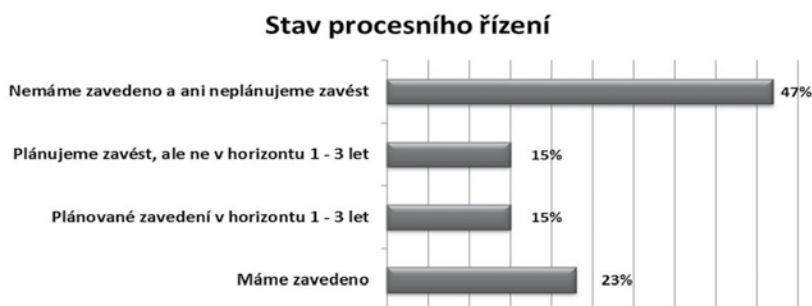
Obrázek 1.2 Stav procesního řízení ve veřejné správě ČR a SR

Další z realizovaných průzkumů byl Průzkum stavu procesního řízení ve veřejné správě ČR a SR , realizovaný Václavem Řepou z katedry informačních technologií Vysoké školy ekonomické v Praze 7 . Z průzkumu vyplynulo, že stav procesního řízení v úřadech odpovídá stavu na obrázku 1.2.