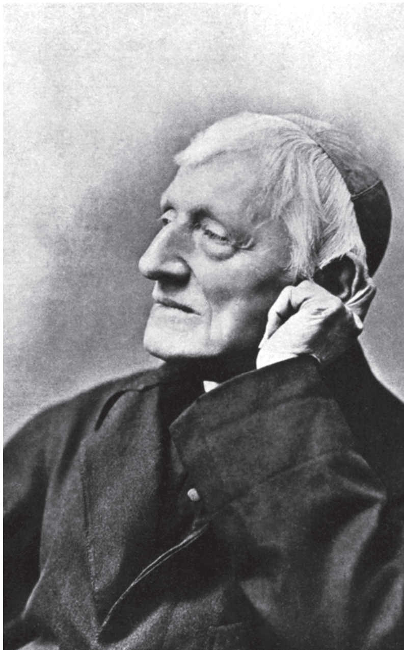
John Henry Newman (* 21. febrúár 1801 – † 11. ágúst 1890)