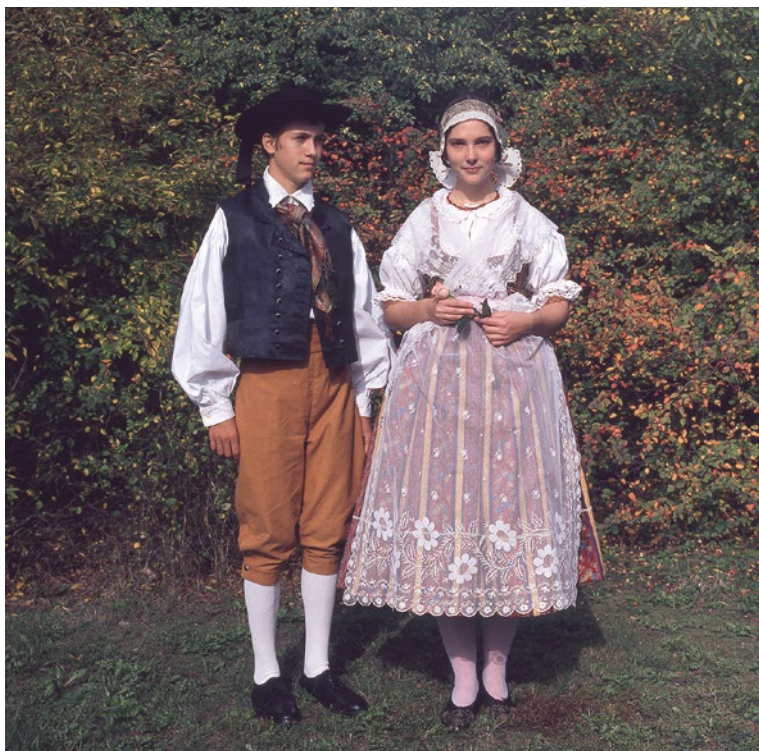
Děvče a mládenec ve svátečních krojích z doby kolem roku 1850, Ruzyně u Prahy.

Výrazný typ středočeského kroje se vytvořil v Dolním Pojizeří, na Mladoboleslavsku , v oblasti, která udržela některé formy šatu jinde převrstvené novotami. V kroji žen zůstávají široké a dlouhé proporce, sukně z ručně tkané nebo unikátně tištěné látky, součásti z plátna se zdobí červenou výšivkou, později i bílým šitím. Čepce mají stuhové holubice, dívky nosí vyšívané vínky a v účesech zdobné jehlice, na šněrovačkách zlaté porty, na krku náhrdelníky z granátů. Mužské ustrojení se v podstatě shoduje s dalšími středočeskými