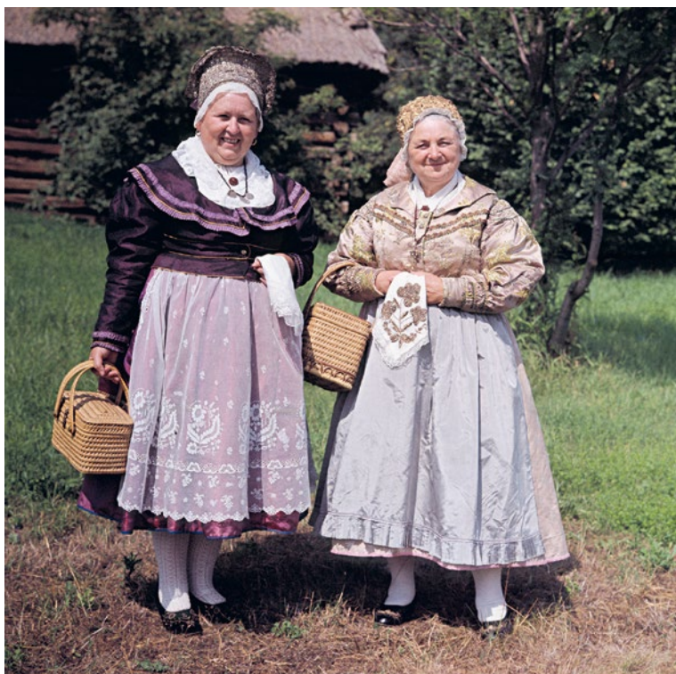
Slavnostní kroje vdaných žen z doby kolem roku 1850, střední Čechy.