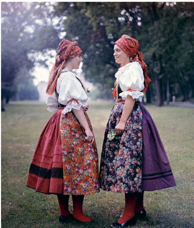
Děvčata v krojích z konce 19. století, Pošumaví.

Tento dobově avantgardní příměr vystihuje tradiční oděv v jeho hloubce a spojení s lidskou bytostí, která mu dává životnost a účel. Podobné, vpravdě antropologické pojetí, je v uvažování o krojovém potenciálu inspirativní i pro naši práci, při vědomí, že mnohé hodnoty minulosti dostaly během času výrazných změn. 1)