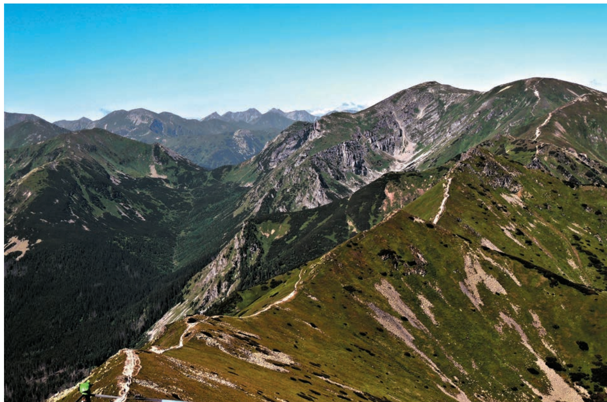
Tomanovská dolina a Červené vrchy

Z opačnej, západnej strany do Tichej doliny spadajú Javorová dolina, ktorá sa nachádza medzi vrchmi Kňazovou a Liptovskou Tomanovou, a severnejšie od nej Tomanovská dolina, ktorá oddeľuje skupinu Červených vrchov od ostatnej časti Západných Tatier. Od roku 2009 je v nej zrušený turistický chodník kvôli ochrane prírody. Spod Malolučniaka, ktorý sa vypína na hlavnom hrebene medzi Kondratovou kopou a Kresanicou, spadá do Tomanovskej doliny Javorový žlab.