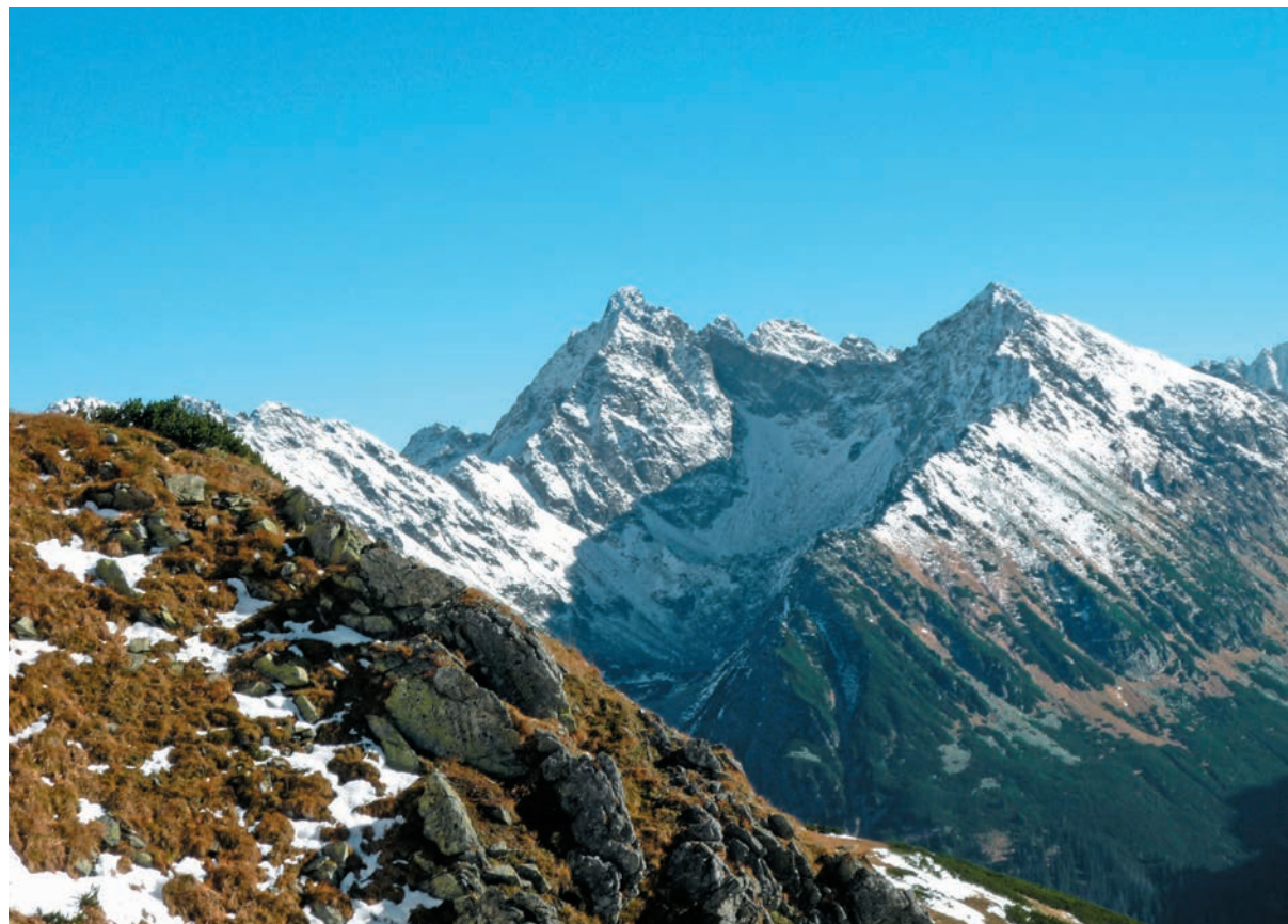
Čubrina a Kôprovský štít

Piargová dolinka je najvyššia časť Temnosmrečinskej doliny a leží nad Vyšným Temnosmrečinským plesom v závere doliny pod Čubrinou a Kôprovským štítom. Od Nižného Temnosmrečinského plesa na sever vidno tiahnucci sa chrbát tzv. Liptovského múru, ktorý sa končí východne v Čubrine (2 376 m). Medzi Čubrinou a Kôprovským štítom (2 367 m) sa nachádza Piargov chrbát. Z južnej strany ohraničuje Temnosmrečinskú dolinu Prostredný chrbát (severozápadné rameno Kôprovského štítu).