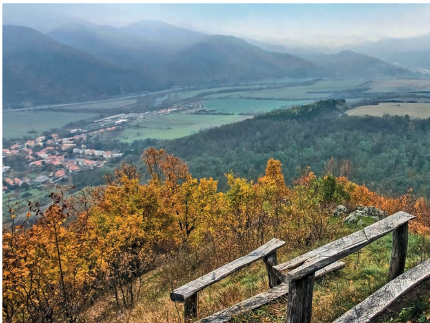
Dolina Hrona z vyhlídky pod Breznickým hradom

podzemného labyrintu vraj bola taká obrovská, že ním prešiel koč ťahaný konským štvorzáprahom. Do takej diery by sa hádam vagóny podzemnej železnice aj zmestili... V podzemných chodbách sa stretne aj so záhadou pre hľadačov pokladov. Traduje sa, že v chodbe vedúcej z Hronského Beňadika do kláštora Máriačalád pri Podhájskej je ukryté ohromné benediktínske bohatstvo. Toto tajné kláštorné podzemie zatiaľ nikto neobjavil, známe sú len chýrne vínné pivnice z tohto okolia.