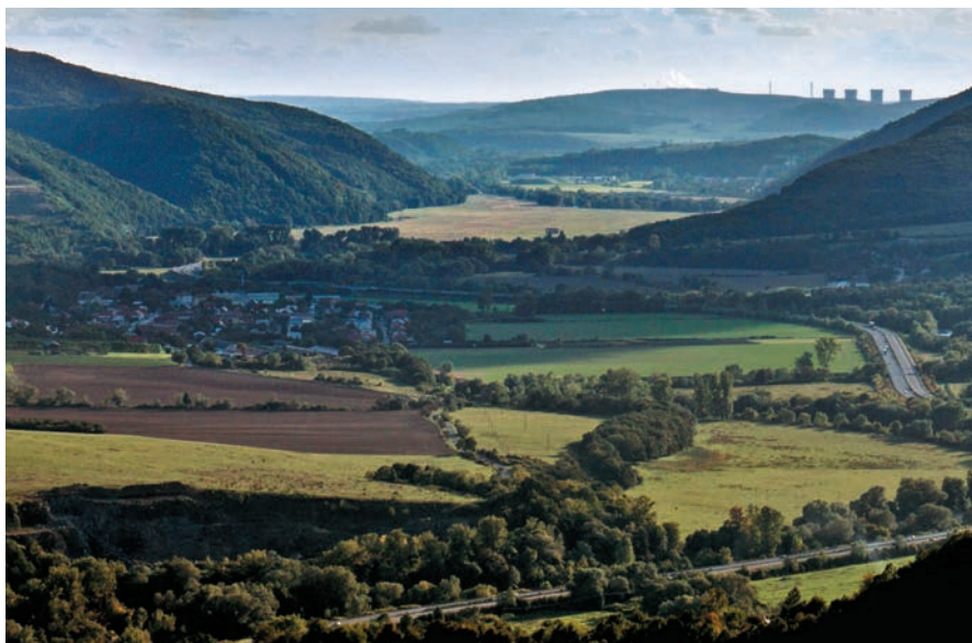
Slovenská brána z Havranej skaly