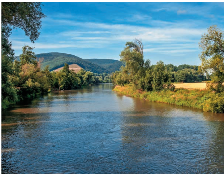
Hron nad Slovenskou bránou pri Tekovskej Breznici Kostol sv. Egídia v Hronskom Beňadiku

Trasa A: Slovenská brána – Hronský Beňadik – Orovnica – Tekovská Breznica – Brehy – Nová Baňa – Veľká Lehota – Hodruša-Hámre – Vyhne – Sklené Teplice – Repište