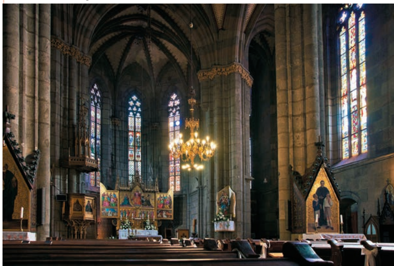
Interiér Baziliky sv. Benedikta v Hronskom Beňadiku

Oveľa hmatateľnejšou a písomne dobre podchytenou pamiatkou