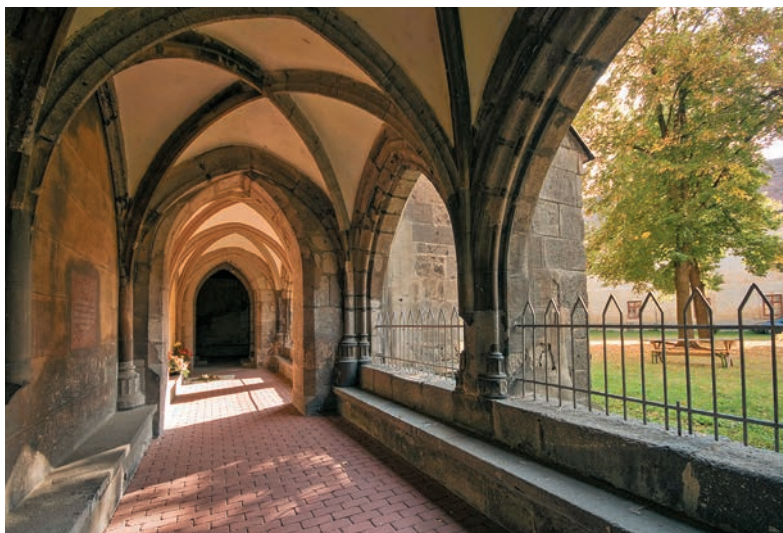
Kláštorná chodba pri Kostole sv. Egídia

cirkevnej administratívy riadenej novým benediktínskym opátstvom. Gejza začaté dielo však nedokončil a po jeho smrti v roku 1077 v ňom pokračoval jeho brat Ladislav I. (asi 1040 až 1095), ktorý sa pre veľké zásluhy o šírenie kresťanstva v Uhorsku stal svätým. Výber polohy budúceho opátstva bol pravdepodobne viazaný na už jestvujúci alebo rozostavaný románsky kostol s výbornou strategickou polohou. Benediktínske opátstvo kontrolujúce Slovenskú bránu mohlo uplatňovať svoje základné poslanie a cez dolinu Hrona kolonizovať karpatské vnútrozemie. Zároveň mohlo medzi ľuďom šíriť kresťanstvo, ktoré v 11. storočí ešte nebolo v horských oblastiach Uhorska dostatočne etablovaným náboženstvom.