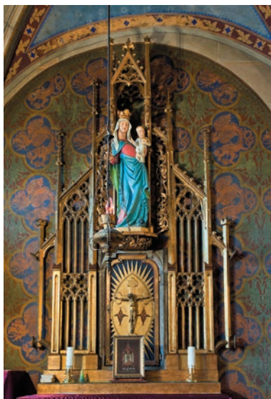
Kaplnka Svätej krvi

krídlach do ďalekej neznámej krajiny a uložili na zámok povýšený na svätostánok Svätej krvi. Svätý grál, strážený na zámku družinou najčestnejších a najstatočnejších bohatierov, tzv. grálových rytierov, je už niekoľko storočí najhľadanejšou svetovou relikviou. Jej hľadačom je zrejmé, že úspech sa môže dostať len vtedy, ak sa im podarí nájsť tajomný zámok grálových