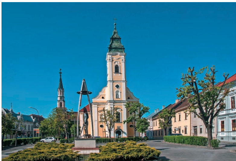
Kubinyiho námestie v Lučenci

živelných pohromách a dnes je na jeho mieste moderné mesto s postavením regionálneho centra. Podľa historikov sa jadro stredovekého a kedysi zemepanského mestčka nachádzalo pod dnešným Kubinyiho námestím. Pod novogotickým kalvínskym kostolom v jeho severnej časti archeológovia objavili zvyšky gotického kostola. Možno predpokladať, že slúžil miestnej farnosti spadajúcej pod Ostrihomské arcibiskupstvo, ktorej