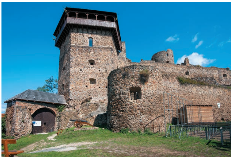
Bebekova bašta Filakovského hradu

pastierskeho psa, ktorý pri strážení oviec vyčuchal veľký poklad. Jeho hodnota bola údajne taká veľká, že sa zaň dal postaviť taký mocný kamenný hrad, ktorý ako jeden z mála dokázal odolať útoku tatárskych hôrd. Keďže psík sa nazýval Ucháň, po maďarsky Füles, nový hrad nazvali Fülek, po slovensky Filakovo.