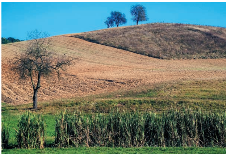
Okolie samoty Bizovo