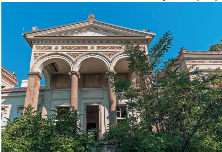
Secesný kaštieľ v Opatovej

Náhodnému návštevníkovi územia juhovýchodne od Lučenca sa bezpochyby musí miestna krajina zdať tajomnou a zvláštnou. Prírodné scenérie pohraničnej oblasti na pomedzí Novohradu a západného Gemera sú na prvý pohľad iné ako v ostatných kútoch Slovenska. Cerová vrchovina je vskutku jedinečným pohorím, ktorému náprotivok musíme hľadať v zahraničí, napr. severne od maďarského Balatonu alebo v oblasti Auvergne v srdci Francúzska. Nie náhodou sa tieto pomerne vzdialené regióny na seba podobajú, spája ich totiž spoločná sopečná minulosť. O niekdajších sopkách, ktoré boli kedysi aj na Slovenku, sme až do začiatku 19. storočia vôbec nič nevedeli.