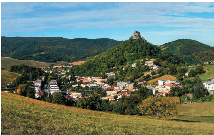
Hajnáčska kotlina v Cerovej vrchovine

Ako prví na to prišli vtedajší vzdanci odhaľujúci prírodnú históriu Štiavnických vrchov a s odstupom mnohých desaťročí sme objavili sopky aj v Cerovej vrchovine. Toto pohorie, zasahujúce aj na územie susedného Maďarska, svoju záhadnú minulosť ani príliš neskrýva, pretože krivky mnohých vrchov sa nápadne ponášajú na sopečné útvary.