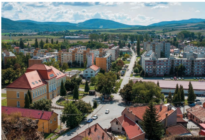
Filakovo z hradu

vpádu do Uhorska v 13. storočí. Archeologické nálezy svedčia o tom, že hradný kopec ľudia obývali už dávno predtým. O tom, ako hrad vznikol, hovorí jedna z miestnych povestí.