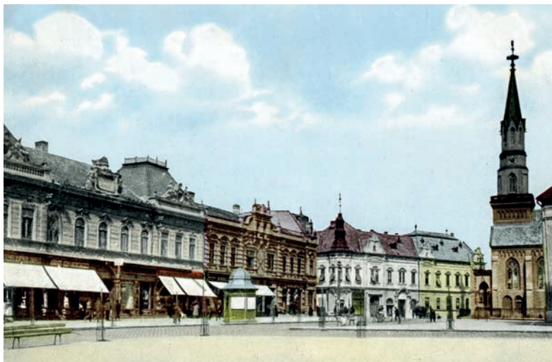
Kubinyiho námestie v Lučenci na začiatku 20. storočia Hrad Šomoška

históriu siahajúcu až do 12. storočia, čomu však nezodpovedá jeho dnešný novodobý vzhľad. Starý Lučenec sa nadobro „stratil“ v neustálych vojnách, povstaniach či