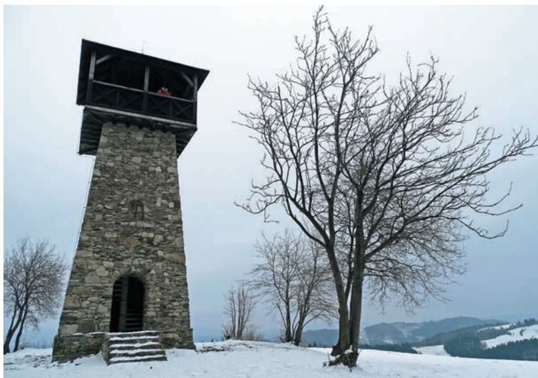
Rozhledna na Marťákovom kopci

Pálenicou a Briavou nasleduje záverečný traverz do osady Husárikovci, kde sa nachádza kaplnka, horský hotel Husárik a lyžiarsky vleč. Do Čadce vedie udržiavaná asfaltová