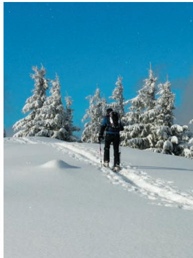
Medzi Semetešom a Husárikom

Z priesmyku Semeteš stúpame po červenej značke lúkou do zalesneného masívu, obchádzajúc Pánovskú Kýčeru (761 m), do osady U Bielov. Severným traverzom Kraviarskej (804 m) prejdeme osadou Bachronovce. Neustále stúpajúc prevažne zalesneným chrbtom zanechávame jednotlivé osady pod hrebeňom, až kým nevystúpime