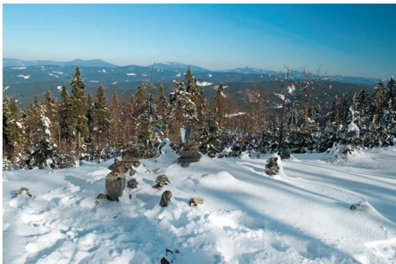
Moravsko-sliezske Beskydy z Veľkého Javorníka