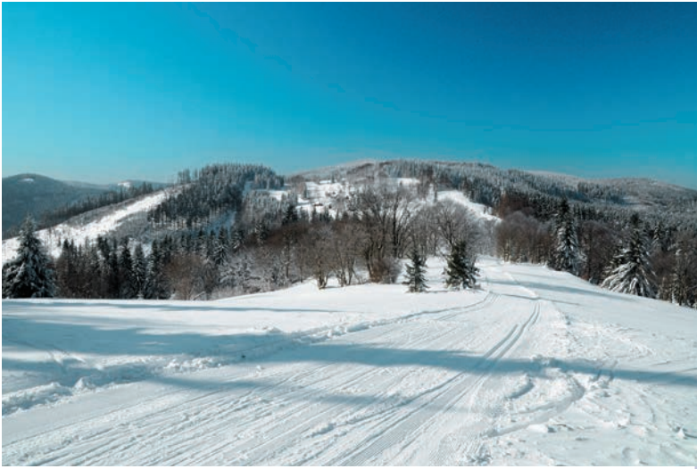
Nad osadou Gregušovci

nevynecháme najvyšší vrch pohoria a pokračujeme priamo nahor na vrchol Veľkého Javorníka.