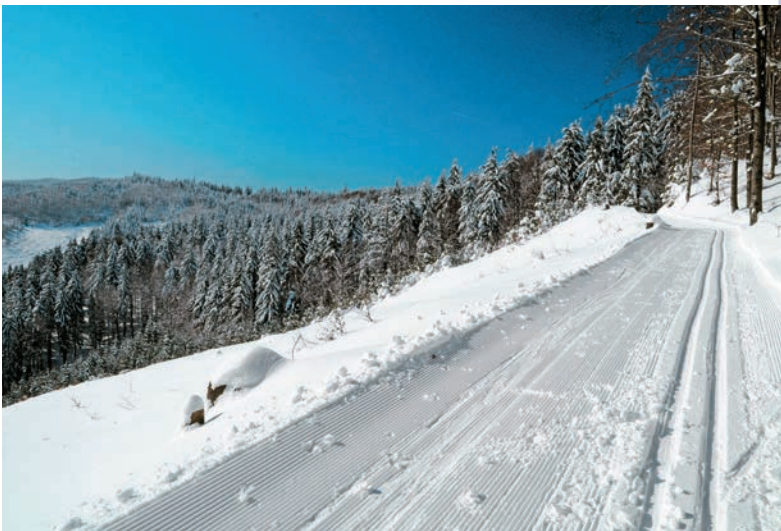
V okolí Čerenky

Vrátíme sa na rázcestie Butorky a sledujeme dobrú stopu lemovanú