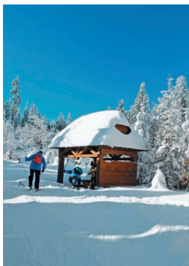
Sedlo pod Hričovcom

Za Stratencom pôjdeme jednou z najkrajších pasáží trasy. Z mierne zvlnenej a bežkársky lahodnej hrebeňovky sa nám ponúknu nádherné výhľady na Moravsko-sliezske Beskydy na západe. V sedle Gažov stojí drevený prístrešok a doľava odbočuje žltá značka na Kasárne, po ktorej pokračuje v zime upravená lyžiarska stopa. My však