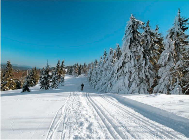
Medzi Stratencom a Veľkým Javorníkom

Javorník, ktorým prechádza štátna cesta. V hostinci U Melocíka máme dobrú možnosť občerstviť sa.