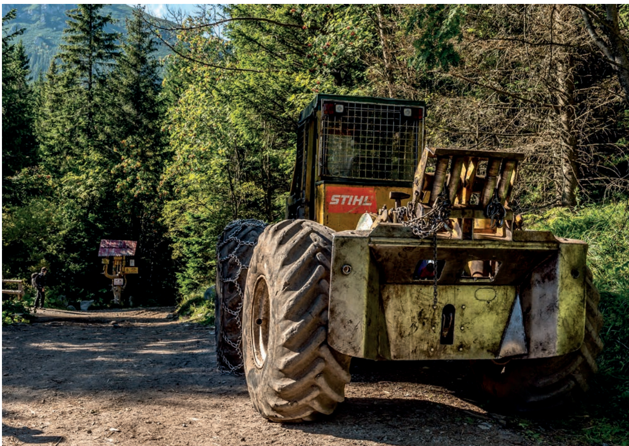
Lesný kolesový traktor vo Vysokých Tatrách