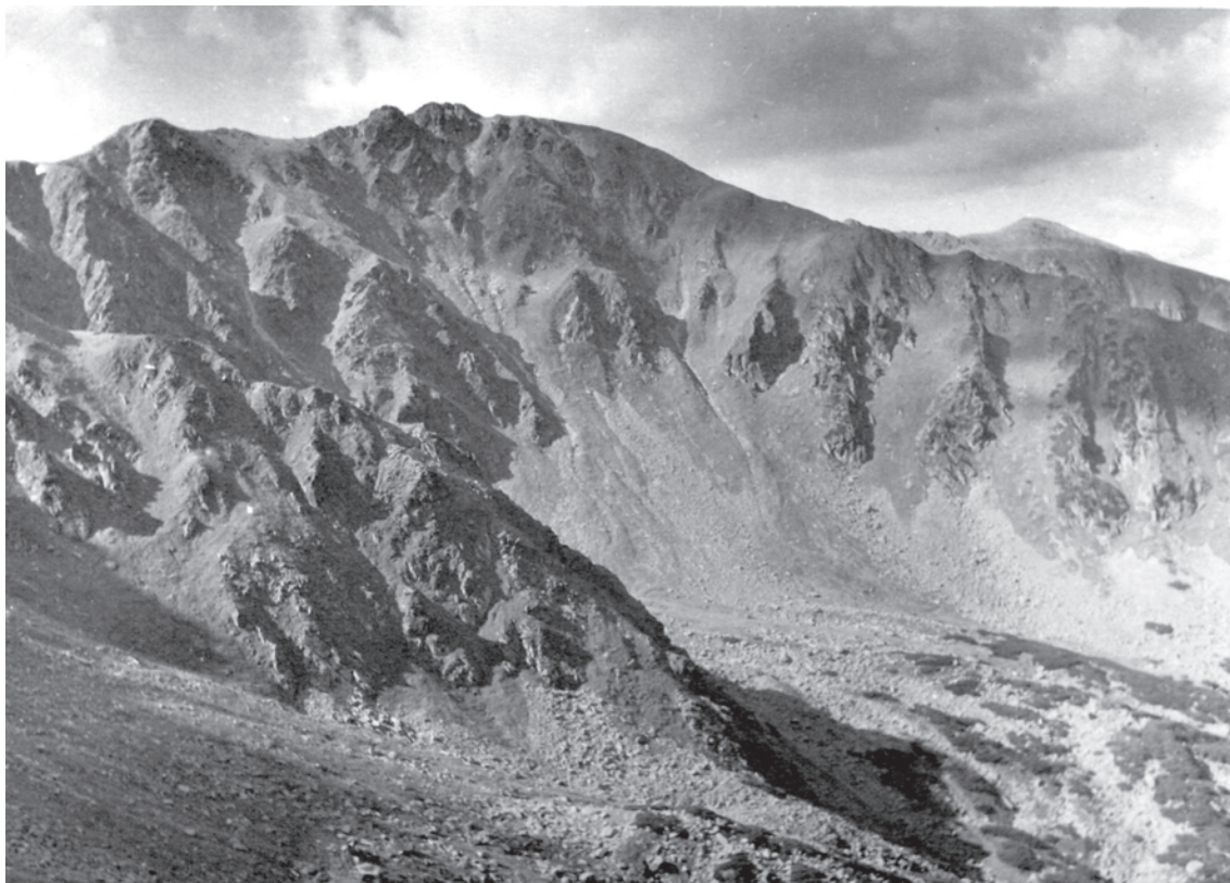
Dereše v Nízkyh Tatráh