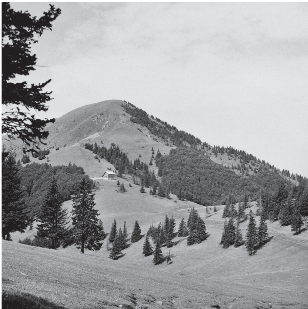
Chata pod Borišovom