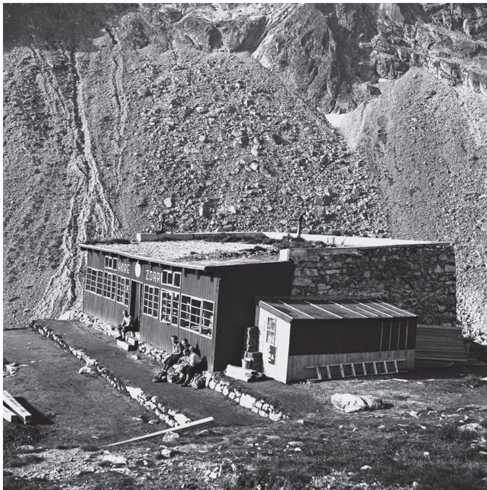
Zbojnická chata vo Vysokých Tatrách