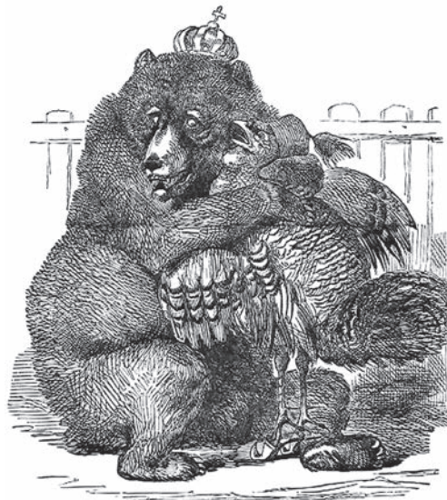
Turecký krocan v objetí ruského medvěda

Nejdříve vysvětlil car svůj postoj k francouzskému králi těmito slovy: „Ludvík Filip je pro Evropu požehnáním, s tím upřímně souhlasím. Ale já nikdy nebudu jeho přítelem... Vždyť aby si získal svou pozici a udržel se v ní, pokusil se podkopat naopak mou jako ruského vládce a to mu nikdy nezapomenu.“