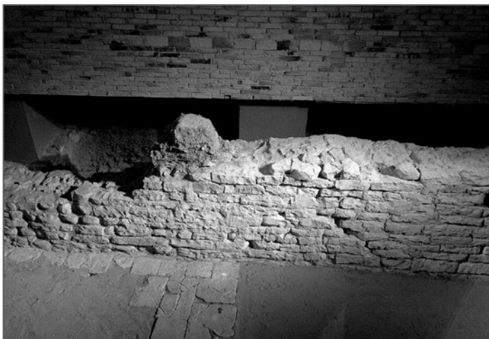
Pozůstatky nejstarších staveb na Pražském hradě

Když už jsme u toho, nejde tak úplně vyloučit, že právě výroba železa byla jedním z důvodů, proč na sousedním Opyši vzniklo opevněné místo, dnešní Pražský hrad. Samozřejmě vím, že podle „oficiální“ historie byl tím důvodem brod přes Vltavu v místě, kde se díky vnitrozemské deltě řeka rozlévá do mělčin mezi ostrovy – odtud prý jméno Praha jako prahy v řece –, ale bylo to tak doopravdy? Jistěže je třeba střežit brod, ale koneckonců řeka jde překonat různými způsoby a na mnoha místech. Zato petřínští výrobci železa nadaní posvátnou mocí byli v pravěku tím, čím za druhé světové války jaderní fyzikové vyvíjející atomovou bombu v Los Alamos – a to bylo hlídané velmi důkladně. Stejně tak jméno Praha nemusí být odvozeno od prahů v řece, ale od pražení rudy, což je proces, při kterém se v surovině zvyšuje obsah železa před finálním zpracováním. Jakési posvátnosti Petřína nasvědčuje i legenda tvrdící, že v předkřesťanských dobách stál v místech dnešního kostela sv. Vavřince pohan- ský „časoměrný sloup“, tedy nejspíš něco na způsob menhiru sloužícího astronomickým a kalendářním účelům. V časech