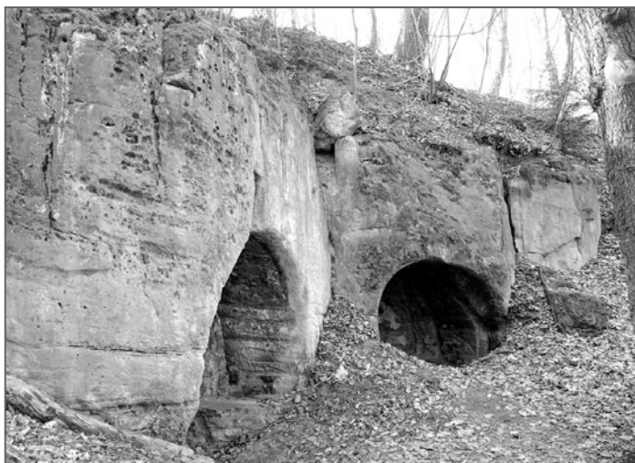
Petřínské skály s jeskyněmi

Buď jak buď, genius loci pahorku Žiži byl odpradávná tak silný, že se přenášel na náčelníky a knížata, kteří Opyš ovládli a disponovali tak jeho magickou mocí. Odtud nebylo daleko k nápadu si kultovní místo pro sebe co nejlépe pojistit. A proti mocichtivým skeptikům, co nevěří na magické síly posvátných ohňů, ale o to víc v sílu svých mečů, nejlépe fungují sice nemagické, ale o to spolehlivější příkopy, valy a palisády. Tak nějak možná vznikl zárodek Pražského hradu.