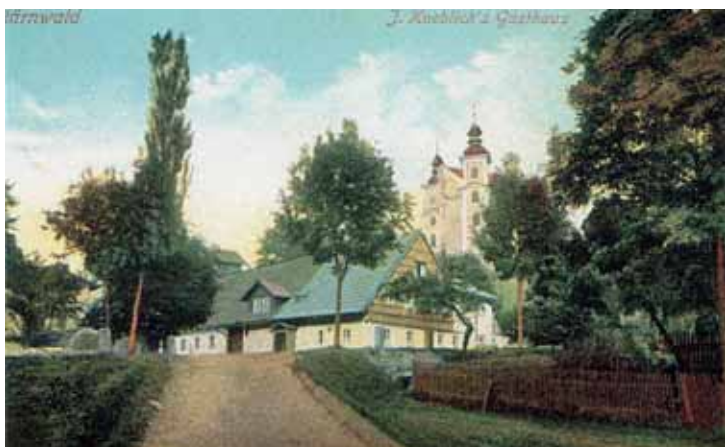
▲ Kostel Nanebevzetí Panny Marie a část Neratova na dobové pohlednici.