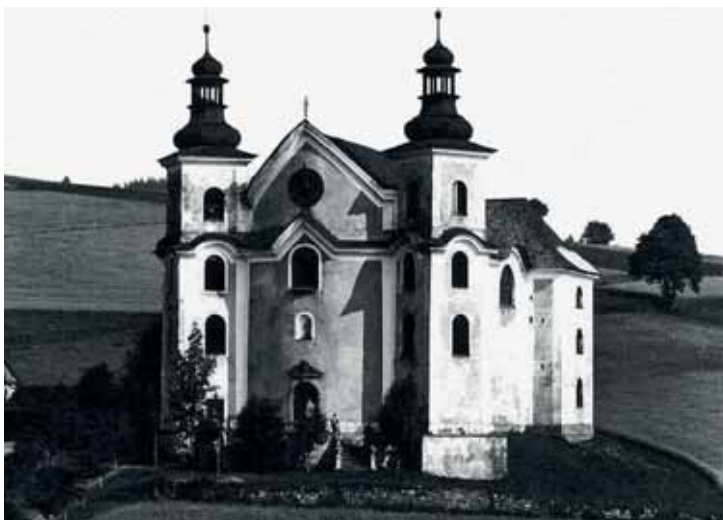
▲ Kostel ještě v plné kráse. Jeho okolí bylo méně zalesněné než nyní.