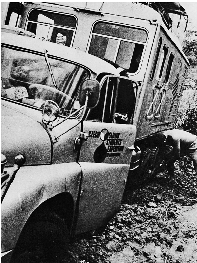
Obrázek 1.: Z expedice LAMBARÉNÉ 1968