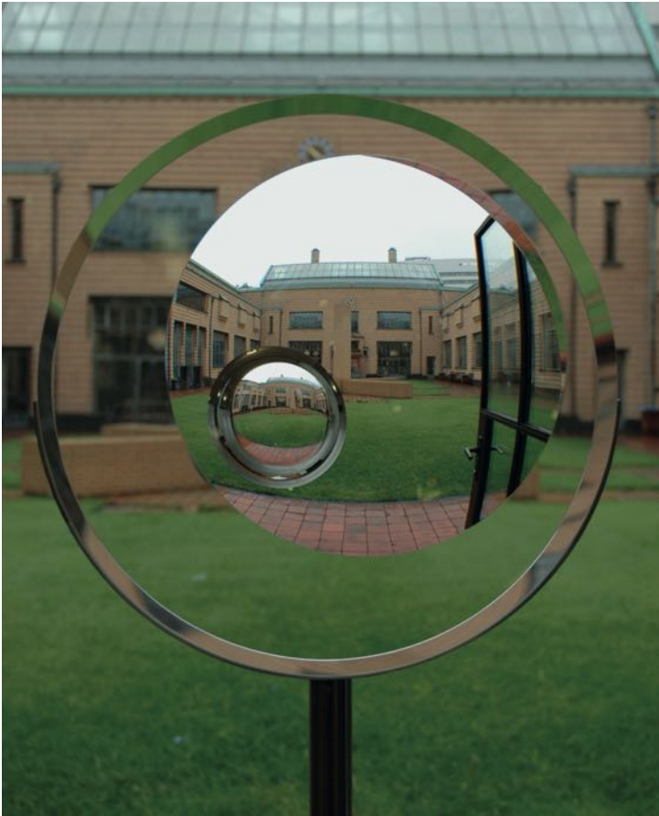
Průzor , 2004, optické sklo