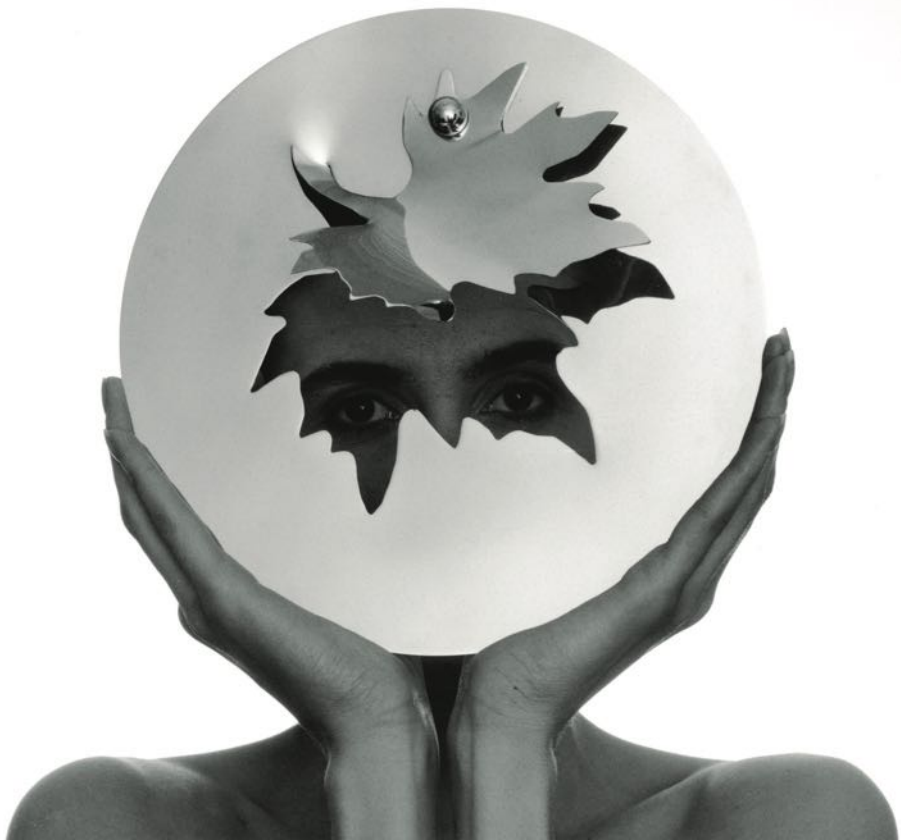
Maska před obličej, 1965