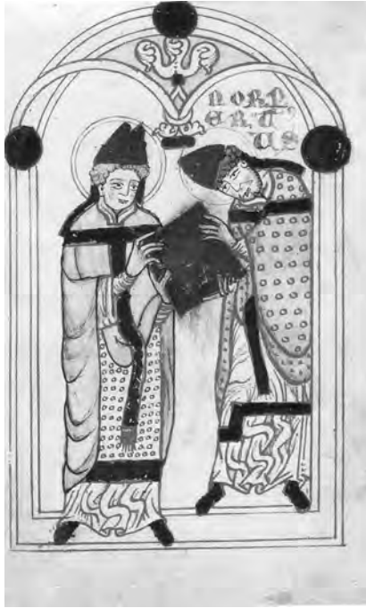
Sv. Augustin předává Norbertovi řádová pravidla (miniatura z prvního Norbertova životopisu, kolem r. 1140)

a Hradčany jsme poznali kapucíny). V západní církvi dnes rozeznáváme sedm hlavních forem řádového života – a řeholní kanovníci jsou jednou z nich. Kromě premonstrátů k nim patří augustiniáni.