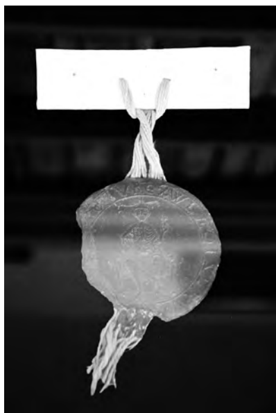
Pečeť Vladislava II.

Víme, že Jindřich Zdík vykonal v roce 1138 spolu s opatem Sázavského kláštera Sylvestrem pouť do Svaté země. Nejenže si odtud odvezl vzácnou relikvii – zlomek svatého Kříže –, ale také tam pojal záměr založit v Praze klášter řeholních kanovníků, snad na způsob kanovníků Božího hrobu. Později to ani být nemohlo, jinak by nebylo možné jmenovat mezi zakladateli pražského biskupa Jana I., který umírá už napřesrok.