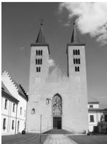
Milevský klášter s bazilikou Navštívení Panny Marie

ně, nebo pod tlakem příslušného biskupa – a že vznikaly také nové kanovnícké komunity.