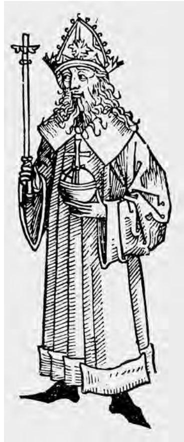
Karel IV. na vyobrazení v Schedelově kronice