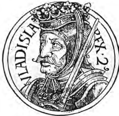
Král Vladislav II.