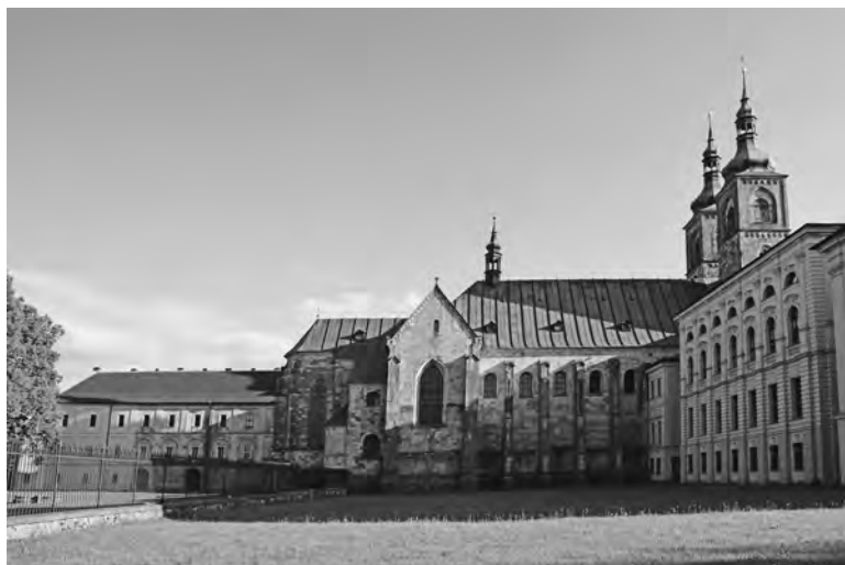
Kláster Teplá s kostelem Zvěstování Páně

ku éry tohoto parazita, v letech 1577 a 1578, držel Strahov pouhé čtyři vesnice z původních 90 (!) a ožíval pouze tehdy, když do něj z města přicházel mladý bratr původem z Teplé a sloužil v kapli svaté Voršily mši. Poté, co na trůn usedl Rudolf II., vrátili se na Strahov tři řeholníci a onen obětavý mladík z Teplé se stal jejich převorem. Brzy se s ním znovu setkáme.