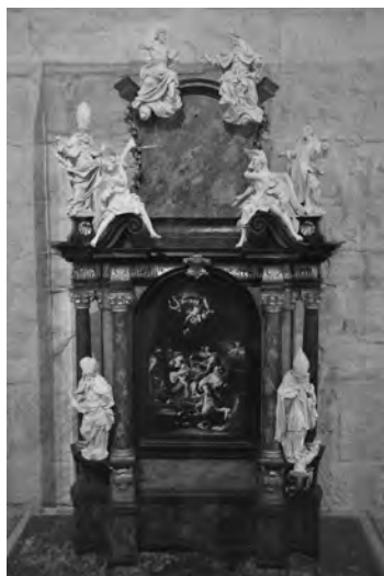
Vstup do kláštera v Doksanech a model hlavního oltáře v tamějším kostele Narození Panny Marie v Doksanech (František Preiss, 1703, Strahovská obrazárna)

do Steinfeldu, jednak není v řadě strahovských opatů vůbec uváděn. Za prvního tedy považujeme Gezona.