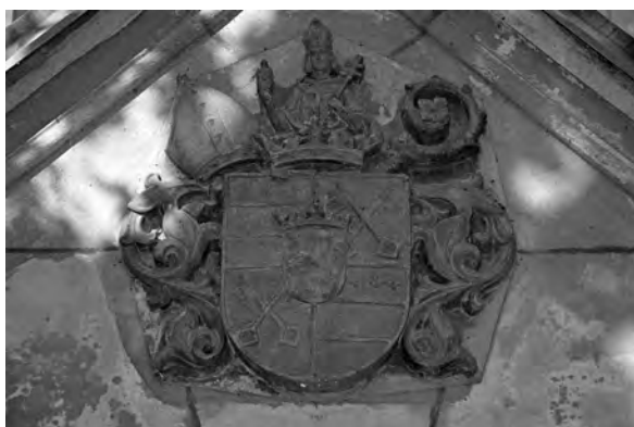
Fara a kostel sv. Cyrila a Metoděje v Praze-Nebošicích; sv. Norberta a jeho následovníky nacházíme i zde

Norbertem. Třetí řády nacházíme i u jiných řeholí, ovšem premonstrátský má výjimečné postavení: je považován z nejstarší v celé církvi.