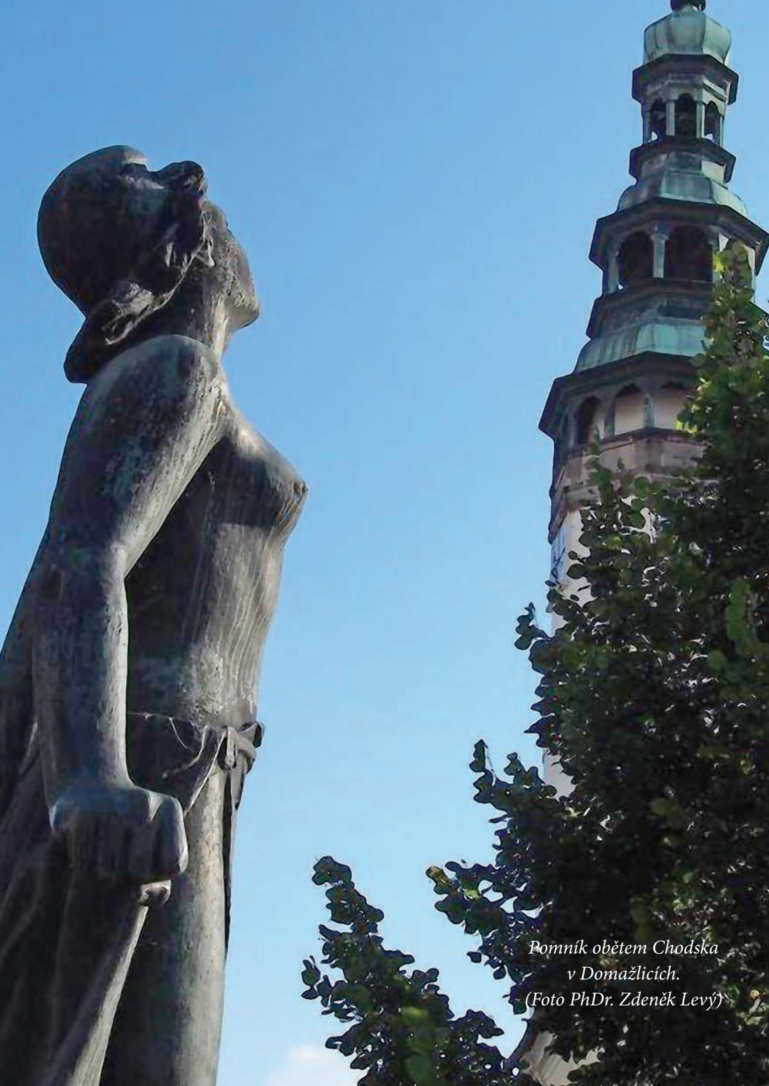
Pomník obětem Chodska v Domažlicích.