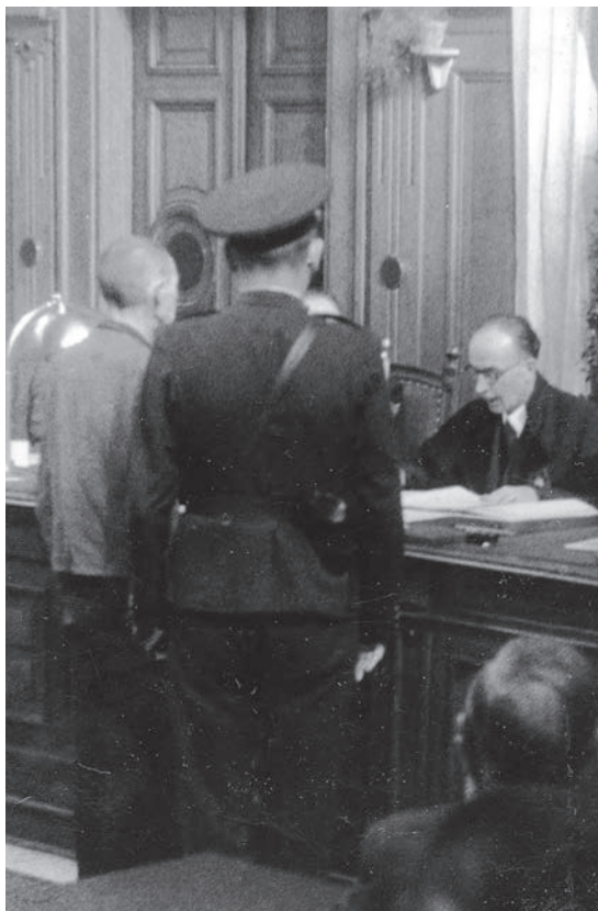
Soudy s příslušníky Gestapa.

dělní tresty byly obvykle vždy více pod drobnohledem veřejného mínění než tresty jiné a byly v očích široké veřejnosti jakýmsi lakmusovým papírkem, signalizujícím na jedné straně spravedlivý trest za krutou, až patologickou nemilosrdnost odsouzených zločinců, který však mohl na straně druhé pro pomstychtivou část veřejnosti představovat satisfakci, až vendetu. Z jiného úhlu pohledu však některé výroky soudních senátů mohou signalizovat případnou nemístnou shovívavost soudu. 11 Přesto by mělo být samozřejmé, že právní pohled a konečný verdikt soudu nesmí