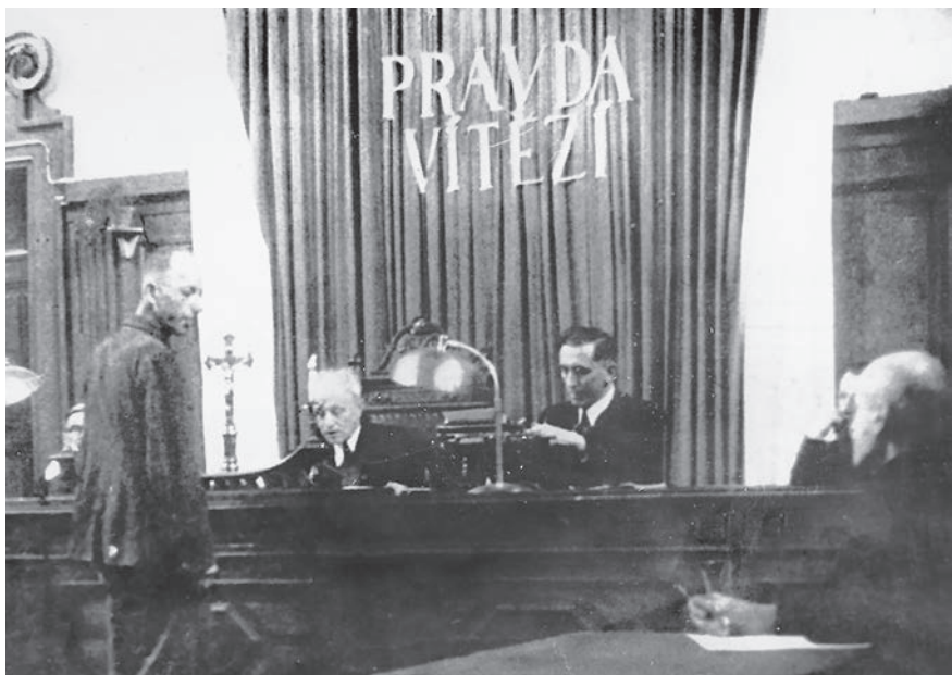
Soudy s příslušníky Gestapa.