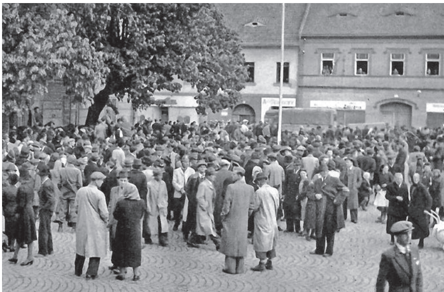
Shromáždění občanů pozoruje na sušickém náměstí vsazení zrádců, udavačů a kolaborantů do místní věznice.

cílem a obsahem této práce. Na tento problém narazila v jedné ze svých studií i Kateřina Lozoviuková. 14