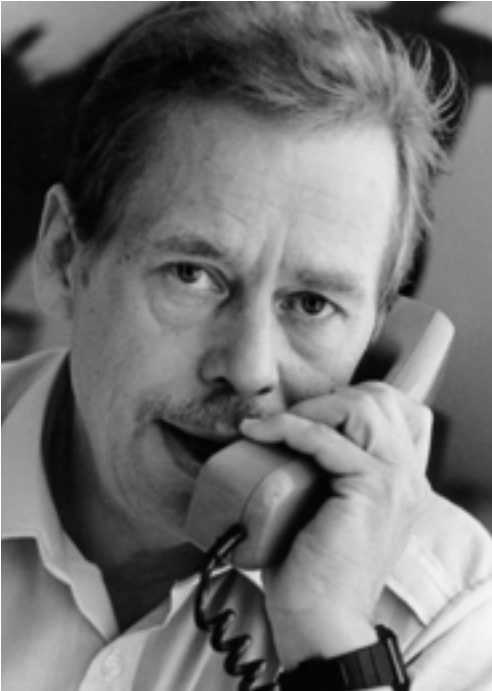
Václav Havel

Američtí kongresmani Dennis DeConcini a Steny Hoyer navrhli Václava Havla na Nobelovu cenu míru. Ve svém zdůvodnění mimo jiné uvedli: „Zatímco v jiných východoevropských státech lze pozorovat podstatný pohyb k větší demokracii, Československo zakouší vlnu represe, jejíž drsnost a rozsah nemají od let 1968–69 obdobu. Ani to však neotráslo Havlovým zaujetím pro mír a lidská práva a jeho kritičností k stavu lidských práv v Československu.“