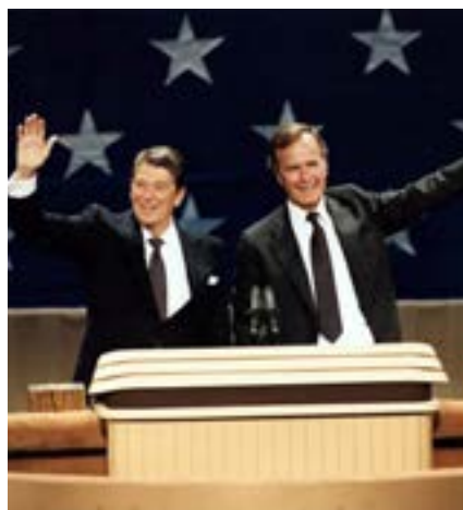
George Bush (vpravo) nahradil ve funkci Ronalda Reagana

Republikán George H. W. Bush byl 20. ledna inaugurován 41. prezidentem Spojených států amerických. Do té doby působil jako viceprezident Ronalda Reagana.