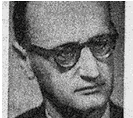
Jiří Hájek byl čsl. ministrem zahraničních věcí v době Pražského jara.

První únorový den vznikla Obroda: Klub za socialistickou přestavbu. Jejimi členy se stali převážně bývalí představitelé Pražského jara z roku 1968, kteří byli po nástupu normalizace z KSČ vyloučeni. Řadili se mezi ně osobnosti jako Čestmír Císař, Jiří Hájek nebo Věněk Šilhán. Klub usiloval o změnu poměrů v Československu v duchu Pražského jara a Gorbačovovy perestrojky a vycházel důsledně z levicových pozic. Během listopadu 1989 se stal součástí Občanského fóra, jeho představitelům se ale nepodařilo výrazněji prosadit.