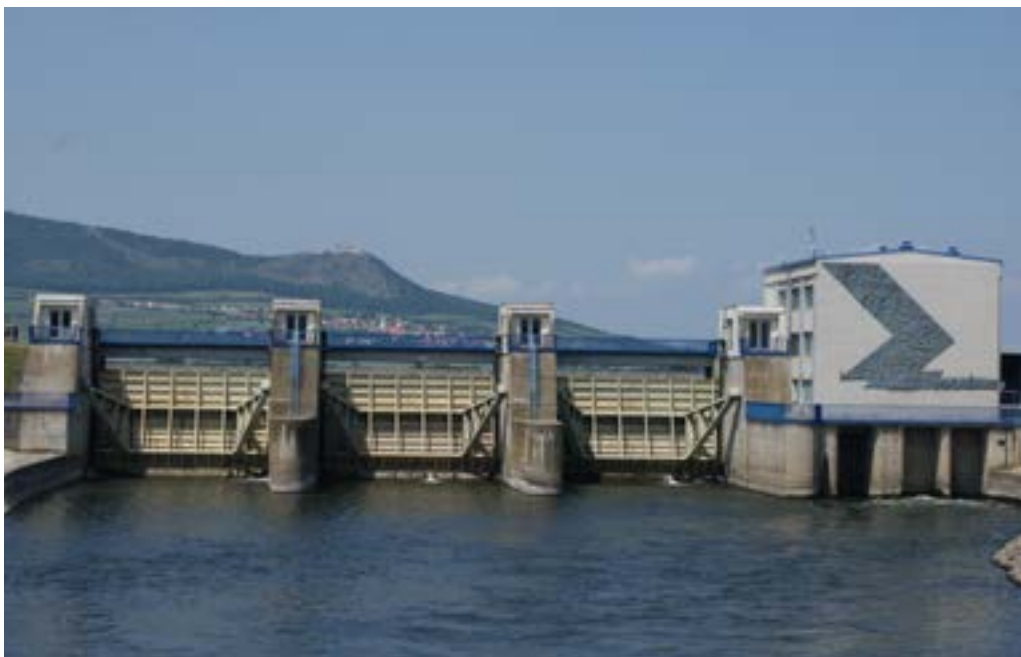
Vodní nádrž Nové Mlýny

zowiecki. Hlavním reprezentantem zdánlivě roztržštěné opozice ale bylo odborové hnutí Solidarity. Vládní síly zastupoval např. Leszek Miller, Czesław Kiszczak, slovo měl pochopitelně i dosavadní šéf polských komunistů Wojciech Jaruzelski. Obtížná jednání trvala dva měsíce, povedlo se však dohodnout postupný nekrvavý ústup polských komunistů od moci, legalizaci Solidarity a polosvobodné volby v červnu téhož roku.