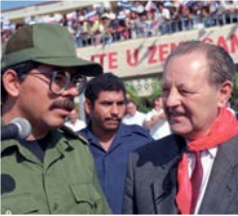
Miloš Jakeš a Daniel Ortega

nec k uspořádání polosvobodných voleb a postupnému přechodu v demokracii.