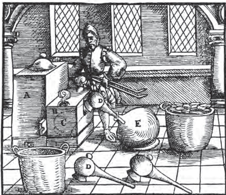
Alchymista v laboratoři

ním přírodních procesů je možné dosahovat dokonalosti. Tedy získávat z olova či rtuti dokonalejší kov – zlato – prostřednictvím kamene mudrců či dosáhnout lidské dlouhověkosti prostřednictvím elixíru života neboli „pitného zlata“.