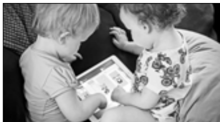
30| Jak se s dětmi neztratit v digitální džungli