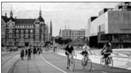
20| Kodaň — zelený grál mezi mestami?