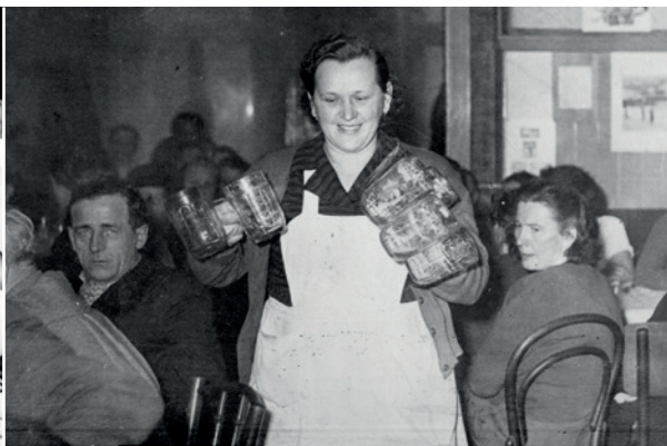
Maminka má snad křídla?