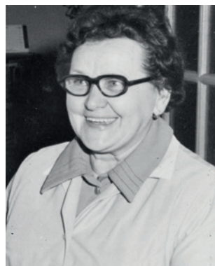
Maminka ve svém království