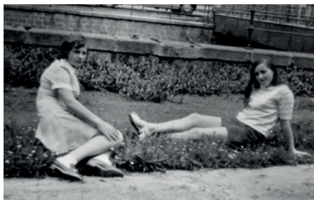
Na české vesnici

Doma ji od dosti nezvyklé záliby neodrazovali. „Táta mě podpo-