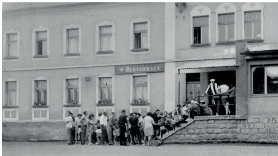
Za chvílku otvíráme

Po válce zůstali v Sudetech po odsunutých Němcích hodnotné majetky, jeden se v roce 1947 rozhodla zvelebit i pražská rodina. „V rámci osídlení přivedl otec mamku do Kněžic na statek. Doprovázeli je babička s dědou, přestěhovali se koňmo,“ líčí další osud nejbližších. Dobytek na statku vyžadoval každodenní pozornost, práce nikdy nekončila. Postarat se musely i ruce vyučené pro práci s drahými kovy. „Máma si vytrpěla své. Bála se kravinců, prasat, táta ji však vzal a postavil doprostřed. Aby si zvykla. Nikdy ovšem nenadávala,“ oceňuje matčinu obětavost.