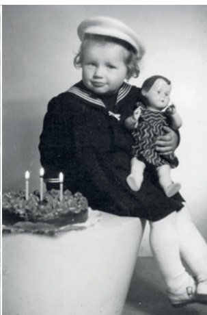
Na dortu jsou tři svíčky