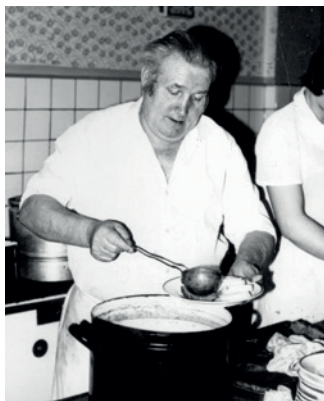
Otec ve svém živlu

Na nějaké stýskání si ale nebyl čas. Hospoda ho krade důsledněji než zručný zloděj. „Táta vařil, maminka obsluhovala. Rekreační oblast, kde byly chaty a koupaliště, přiváděla hodně hostů. Už v 10.30 bývala obrovská fronta,“ vysvětluje, že se ohánět museli všichni. „Jako malá jsem sbí-