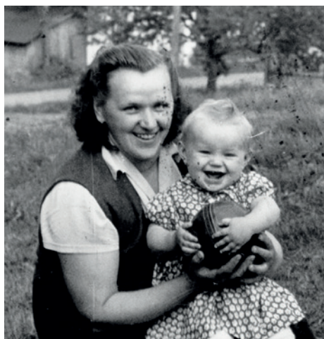
První kontakt s míčem

Nevybavuje si, kdy poprvé kopl do míče. Muselo to být – alespoň je o tom přesvědčená – na hřišti v rodných Heřmanicích. Ostatně co by to bylo za vesnici, kdyby neměla hřiště (a také kovárnu, hospodu a kostel). „Táta dřív za místní klub chytal,“ vyplavují na povrch nezničitelné geny. „Moc si to tedy nepamatuju, ale mám fotky,“ předkládá svědka lapačského umění rodiče.