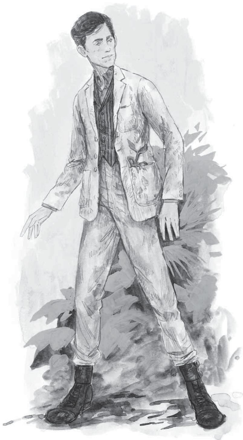
NÁČRTY KOSTÝMOV MLOKA SCAMANDERA