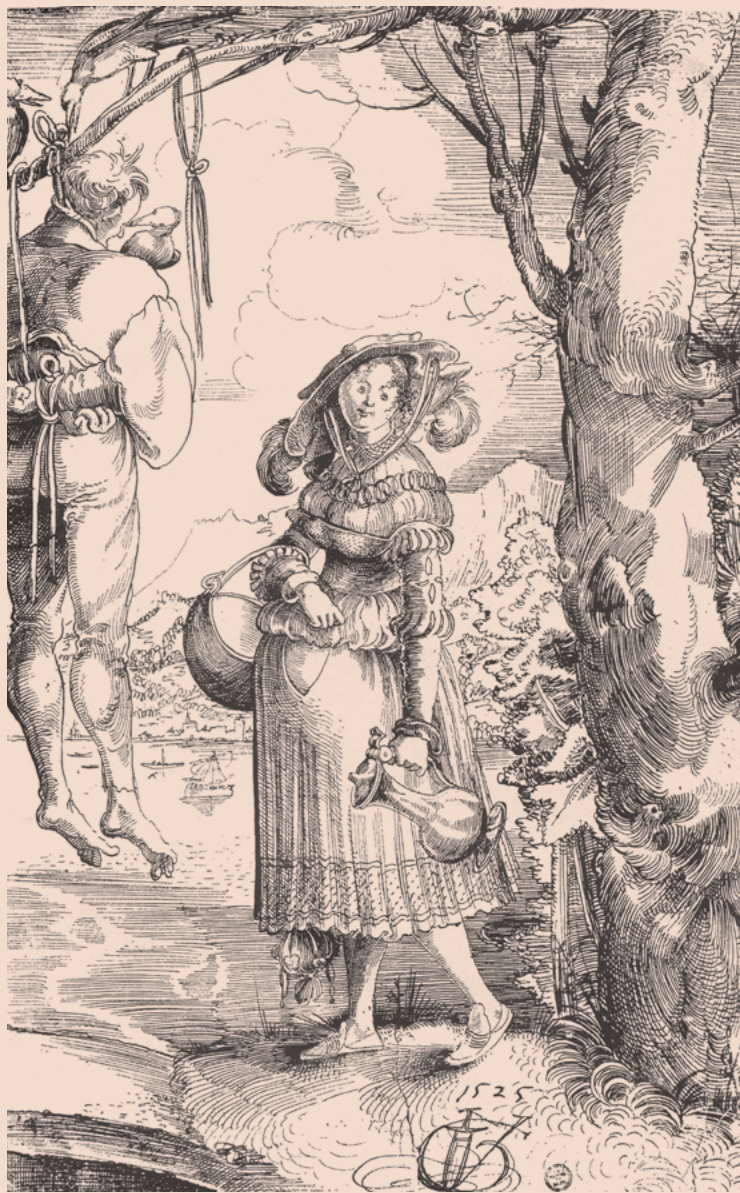
Dívka se džbánem vína a viselcem. Kresba Urse Grafa, který se občas nechával najmout jako žoldněf. Pravděpodobně se účastnil vyplenění Říma – „Sacco di Roma“ v roce 1527, při kterém násilně zahynulo asi dvacet tisíc obyvatel, ale nakradené umělecké památky urychlily postup renesančního umění Evropou.