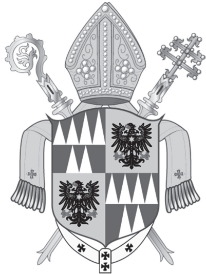
Znak Arcidiecéze olomoucké

Ve Lvu Skrbenském zemřel církevní hodnostář úzce spjatý s osudem habsburské monarchie. Třebaže se vždy hlásil k českému původu, byl zejména po roce 1918 vnímán jako představitel aristokratických rakouských kruhů konzervativního ražení. Navzdory své