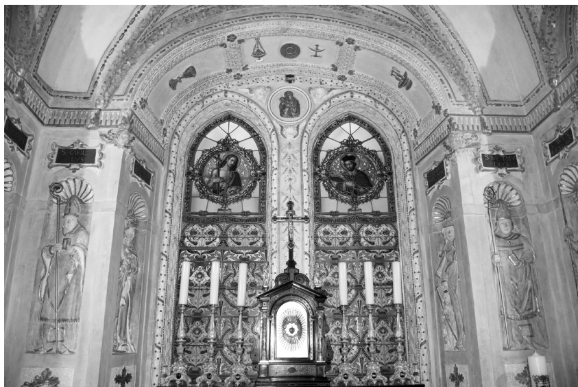
Domácí kaple sv. Jana Křtitele v Arcibiskupském paláci