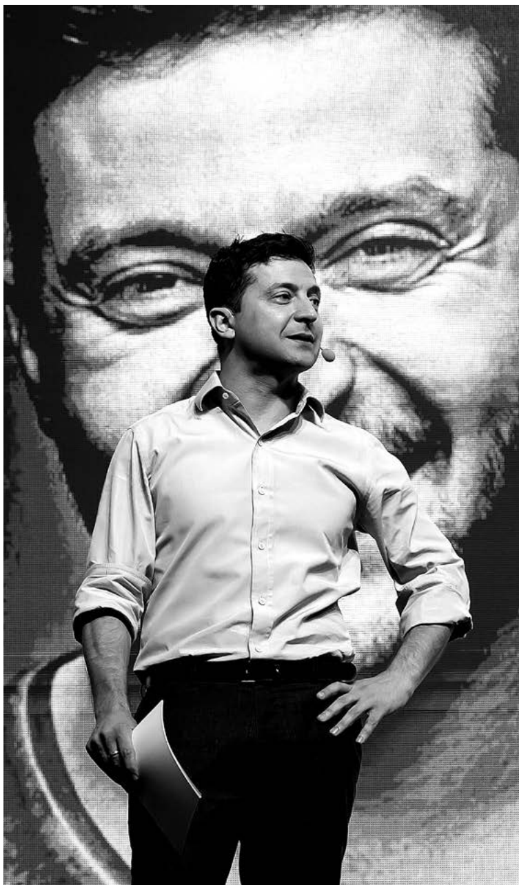
Novozvolený ukrajinský prezident Volodymyr Zelenskyy počas prejavu na IT konferencii v Kyjive (23. máj 2019).