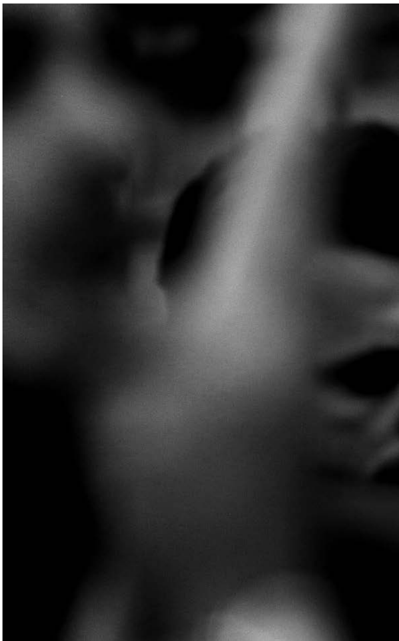
Krvavý Putin. Fotografia z protestu proti ruskej invázii na Ukrajinu, ktorý sa konal v Ríme na Kapitolskom námestí (25. február 2022).