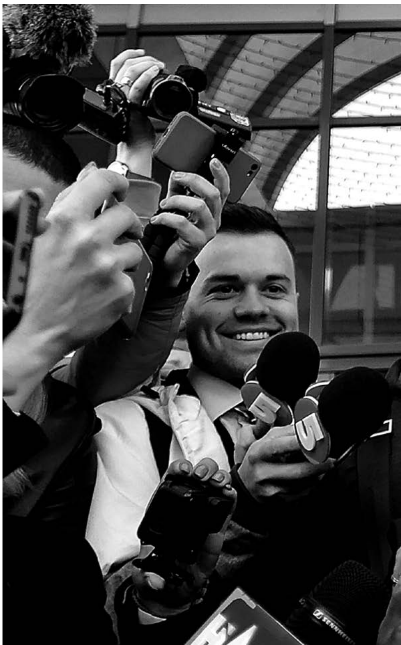
Volodymyr Zelenskij – ešte ako kandidát na hlavu štátu – hovorí po postupe do druhého kola prezidentských volieb s novinármi (5. apríl 2019).