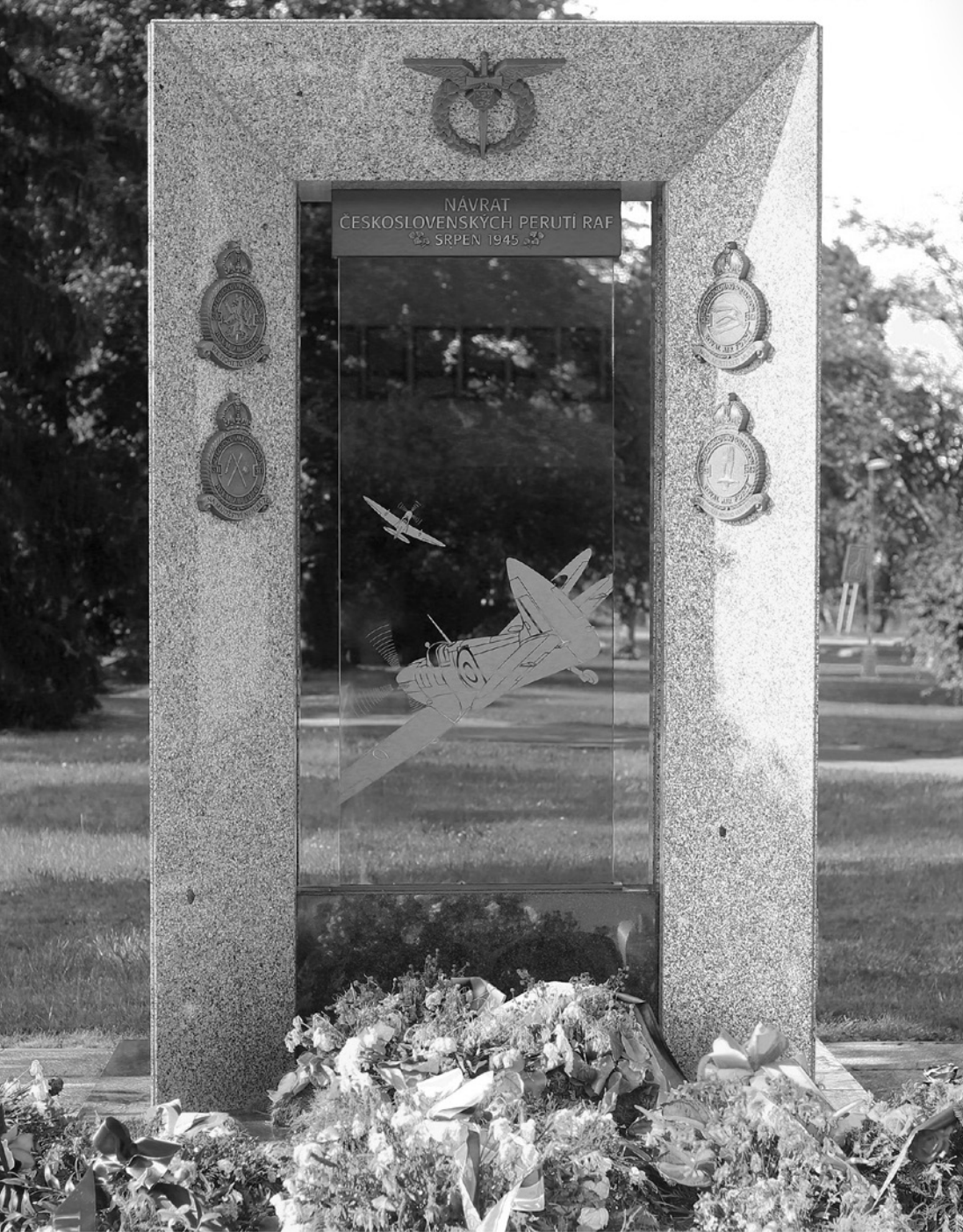
Památník 70. výročí návratu československých perutí RAF. Dílo Martina Zajíčka bylo odhaleno 24. srpna 2015 v parku u haly starého ruzyňského letiště v Praze.