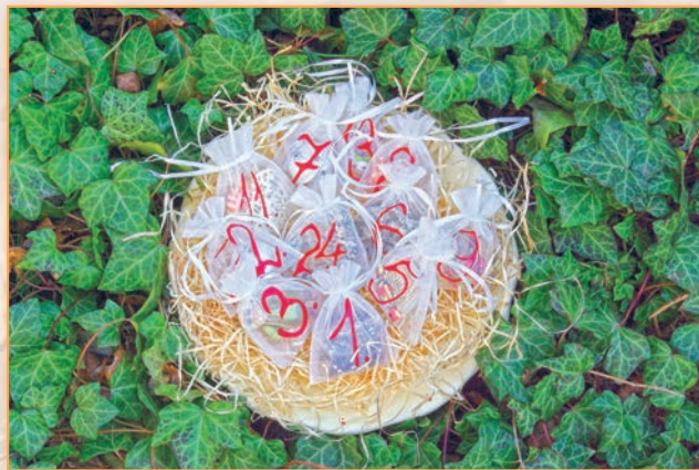
Látkový adventní kalendář