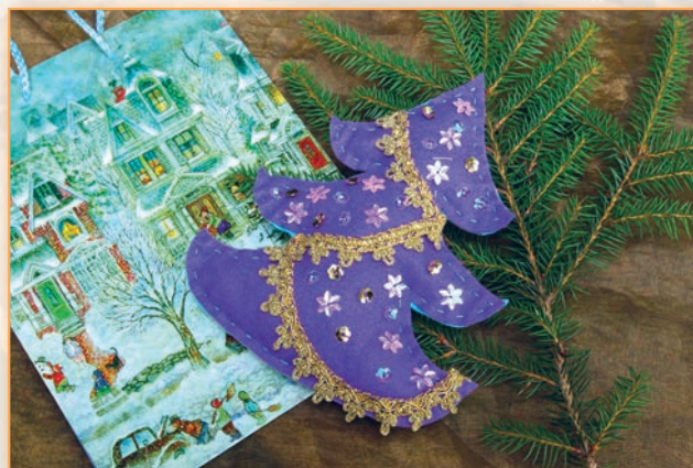
Stromeček z plsti