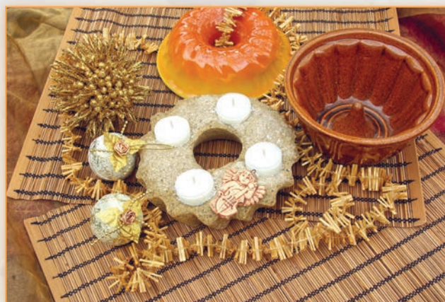
Pískový adventní svícen