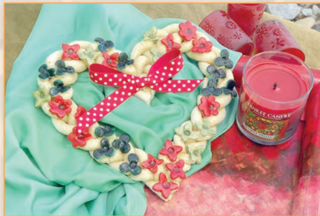
Srdce ze slaneho těsta