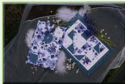
Přání s květinami