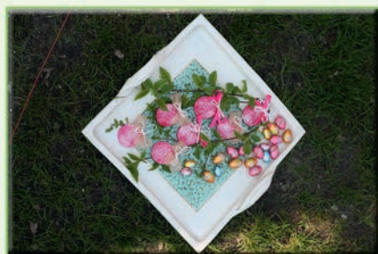
Vajíčka ze samotvrdnoucí hmoty