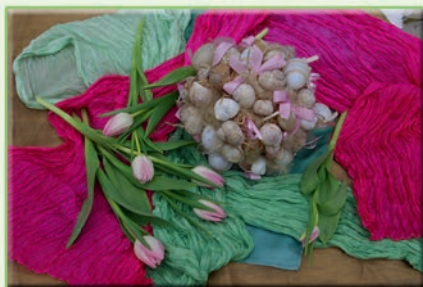
Dekorace z vajíček a ulit