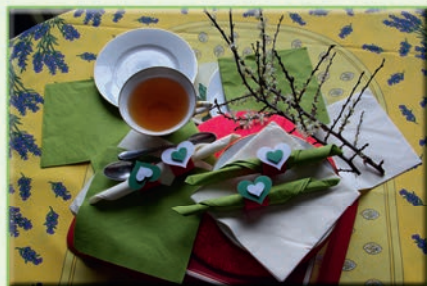
Kroužky na ubrousky