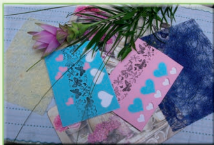
Přání se srdíčky