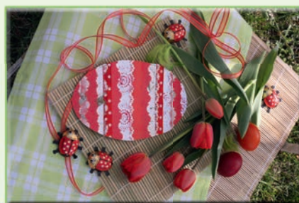
Kraslice z papíru