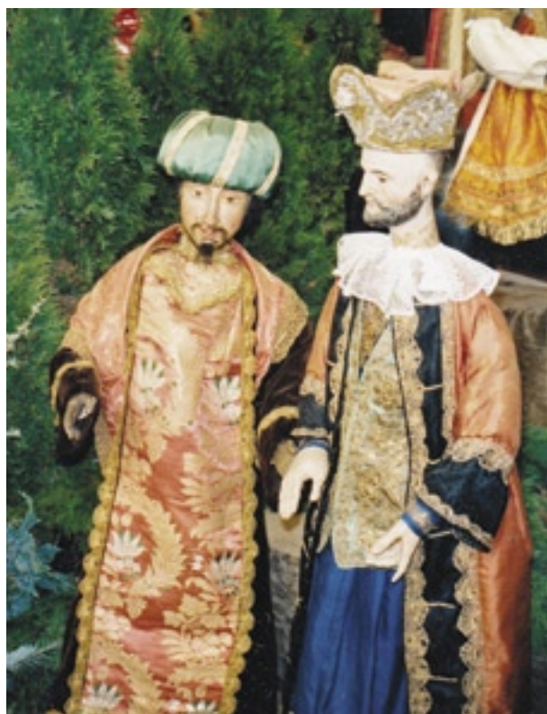
Mindelheim, jezuitský betlém