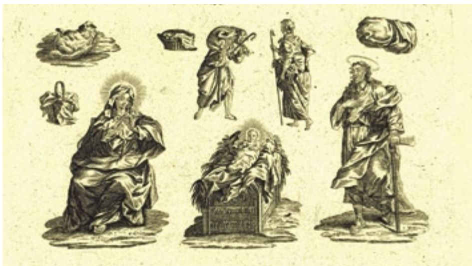
Nejstarší český tištěný arch z grafické sbírky premonstrátů na Strahově, tisk firma Balzer

Doznívání zákazu vystavování betlémů v kostelích trvalo podle důkladnosti jeho dodržování v různých regionech asi do roku 1825. Betlémy se vracejí do kostelů, ale také už trvale zůstávají v domácnostech měšťanů i prostého lidu.