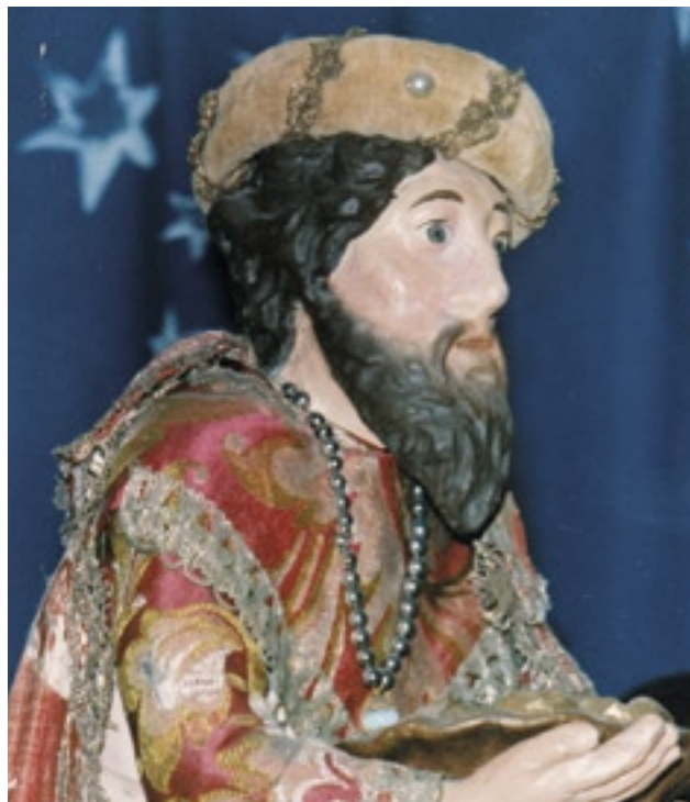
Oblékaná figura krále, muzeum Netolice

Nepočetná je i řada deskových malovaných betlémů, z nich nejstarší je z Nového Bydžova, datovaný už do poloviny 17. století. Deskové betlémy malované na dřevě nebo lepence do oblby uvedly řády františkánů a kapucínů [4].