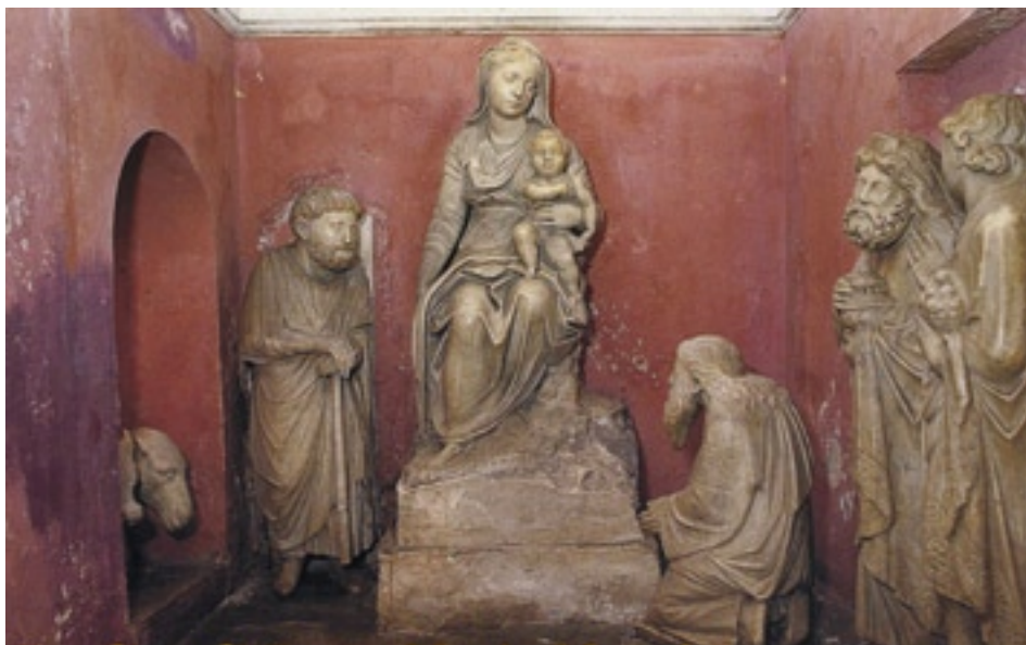
Arnolfo di Cambio: Klanění Tří králů , Řím 1288

Nejstarší známé sochařské zpracování Klanění Tří králů pro baziliku Santa Maria Maggiore vytvořil v roce 1288 italský sochař a architekt Arnolfo di Cambio (1245–1302). Postavy Tří králů, sv. Josefa hlavy osla a vola spolu s pozdější kopíí sedící P. Marie s Ježíškem v náručí se v kostele o Vánocích dodnes vystavují, i když jsou pochybnosti, zda jde o původní soubor.