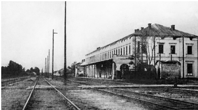
Nádraží v Brodech na hranicích Rakousko-Uherska a Ruska