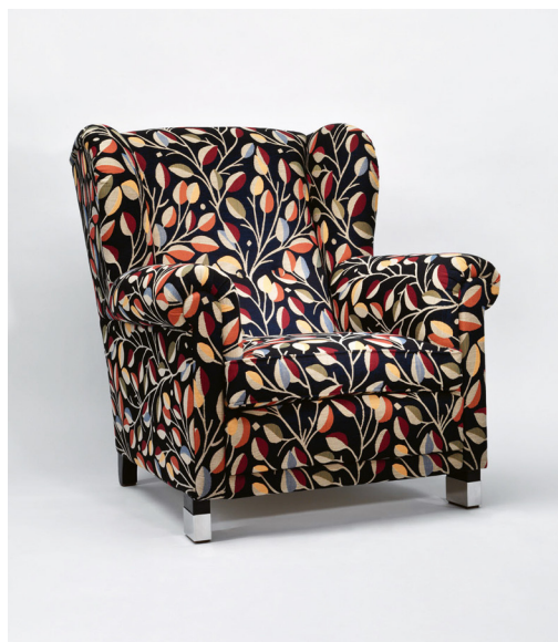
004 Celočalouněné křeslo bez možnosti určit rok vzniku. Vyrábělo se od poloviny meziválečné doby až po padesátá léta

Sortiment nábytku z meziválečné doby zůstal nezměněn, nepočítáme-li průběžnou kontrolu odbytu jednotlivých modelů a z toho vycházející eventuelní vyřazení z výroby. Na to však měla válka jen sekundární vliv; byl to dlouhodobý kontinuální proces i v mírové době. O vyřazování špatně prodávajících modelů byli čtenáři Thonet-Mundus Zentralanzeiger pravidelně informováni. Tato podniková tiskovina byla