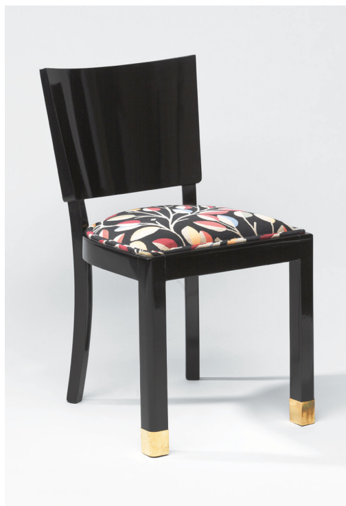
003 Typická židle té doby do domácnosti vyšší vrstvy

Další sedací nábytek zařazený do výroby brzy po vypuknutí války a nesoucí často nepřehlédnutelné rysy německví, byl nábytek do civilních obydlí německých důstojníků. Ti dostávali často byty po emigrovavších nebo v koncentračních táborech uvězněných Židech. Noví nájemníci se někdy štítily bydlet v nábytku po „méněcenné rase“ a raději utráceli peníze za nové vybavení. Vzdělanější, kteří dostali byt po mohovitější rodině, si historicky nebo alespoň esteticky cenného vybavení bytu dokázali vážit a ani je nenapadlo je měnit za méněcenné současné výrobky.