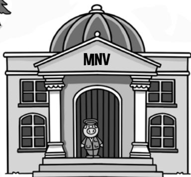
MÚZEUM NAJDOLEŽITĚJŠÍCH VEČÍ