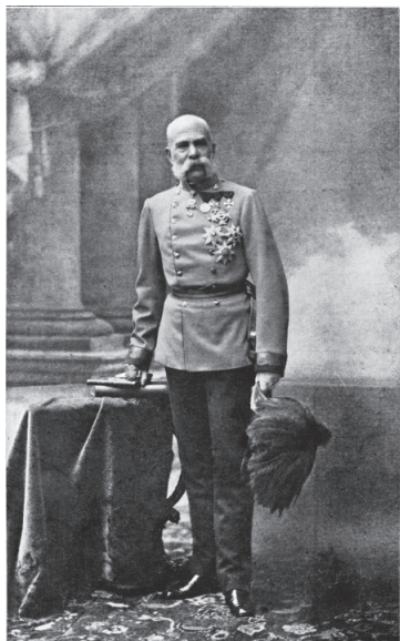
František Jozef, cisár rakúsky, kráľ český a apoštolský kráľ uhorský, vládca impéria od roku 1848 až do svojej smrti v roku 1916; fotografia pochádza z roku 1897.

Nová Viedeň je mesto protikladov. Je to jedno z najbohatších miest Európy, no jeho noví obyvatelia patria k najchudobnejším. Ani výstavba opulentných nových palácov nedokáže zamaskovať otrasný nedostatok dôstojného ubytovania. Viedenský lekári píšú históriu modernej medicíny, robia prvé operácie, objavujú baktérie, vírus obrny, krvné skupiny – no aj tak sa v meste nekontrolovateľne šíri syfilis. Sigmund Freud osvetľoval skryté pudy sexu a agresivity v čase xenofóbie a takého vulgárneho antisemitizmu, že mnohí verili, že Židia zabíjajú deti a miešajú ich krv do kvasu na macesy. „Posvätné mesto hudobníkov“,* preslávené svojou rozpustilosťou, malo najvyšší počet samovrážd* v Európe.