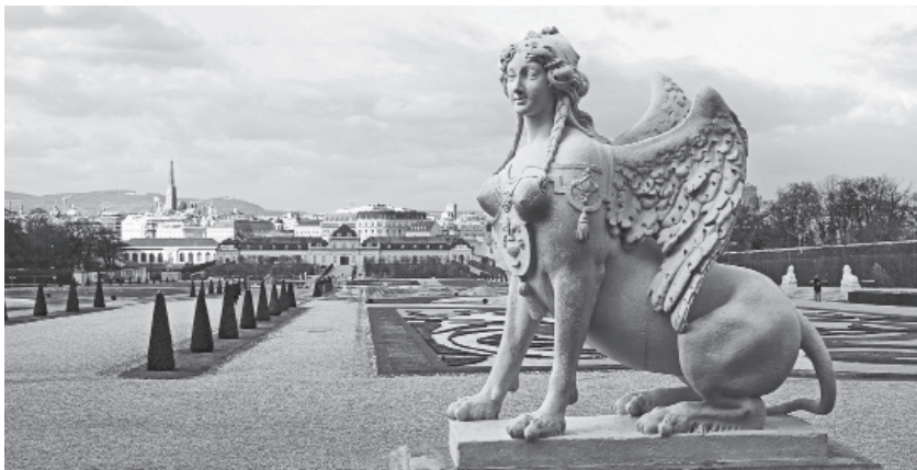
Palác Belvedere princa Eugena Savojského, baroková pamiatka na víťazstvo nad Turkami

kopci si Turci počas posledného veľkého boja východu proti západu rozložili pri obliehaní Viedne svoj tábor. Zelená strecha Bevederu, vypínajúca sa do výšky, pripomína ich stany, trepotajúce sa vo vetre.