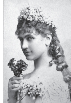
Katharina Schratová, na obrázku približne z roku 1880, bola najväčšou herečkou nemecky hovoriaceho sveta. Cisár František Jozef dal pre ňu v Bad Ischli postaviť vilu, pomenovanú Villa Schrat a prenechal jej ju do vlastníctva.

Adele Bauerová stojí pred zrakmi svojej rodiny v bielej gréckej tunike, v ktorej vynikajú krivky jej tela, štíhleho ako prútik. Husté čierne vlasy jej splývajú až po úzky pás. Adele práve prechádza onou mysterióznou hranicou medzi dievčaťom a ženou. Je oblečená v kostýme jarnej víly, v rukách drží prútený roh hojnosti, plný jarných