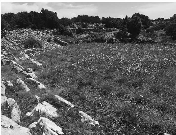
Obrázek P.1. Vrcholky některých „kyklopských“ stěn ohrady a v pozadí další starobylé stavby na ostrově v chorvatské Dalmácii.

nás přitom rozhovor o houbách rostoucích ve sklepech. Při těchto a dalších zážitcích nám bohatství rozhovorů protříbilo myšlenky, vylepšilo jídlo, o které jsme se dělili, a upřímně řečeno, zanechalo v nás pocit štěstí a naplnění.