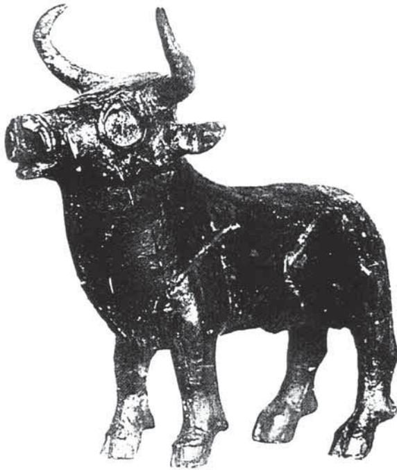
Bronzová plastika býčka nalezená v jeskyni Býčí skála

sice zřejmě odpovídá stavu, v jakém je v předsíni Býčí skály našel, ale ne rituálnímu pohřbu, jak ho známe z jiných nalezišť. Spíše bychom se domnívali, že všechny předměty budou uspořádány v úhledném pořádku, důstojném postavení vznešeného mrtvého, a nikoliv nahodile poházeny. Ale ve skutečnosti neslo dno jeskyně stopy zuřivého a vražedného ničení. Vypadalo to, jako by někoho popadl šílený amok, pod jehož vlivem se doslova