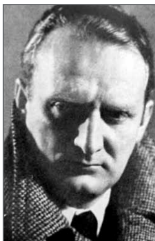
Herec Jiří Plachý zemřel stejně záhadnou smrtí jako Edward Kelly, kterého ve filmu ztvárnil

Ve skutečnosti ale za tragickou smrtí Kellyho představitele mohly být spíš síly z tohoto světa – i když možná ještě zlovolnější než samotné peklo, protože to si bere jen duše zlé. Psal se rok 1952, komunistický teror vrcholil a Jiří Plachý měl za sebou několik výslechů na StB. O tom, proč se o něj soudruzi tak zajímali, a dokonce hrozili, že mu odeberou jeho tehdy pětiletého syna, kolují jen dohady. Podle jedné z verzí mu chtěli přišít kolaboraci s nacisty, protože za války na gestapu úspěšně vymohl zmírnění trestu pro svého bratra. Ale i kdyby to byla pravda, tak rozhodně ne celá, protože skutečnou dráhu kolaborantů s nacisty měla za sebou řada zasloužilých soudruhů (i mezi herci) a nevalilo to, spíš naopak. Někteří se proto domnívají, že Jiří Plachý na nějakého mocného komunistu něco věděl nebo měl kompromitující