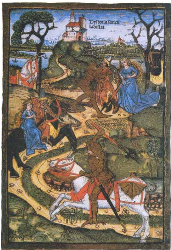
Vyobrazenie kráľa Ladislava I., ktorý zachraňuje pannu unesenú pohanským Kumánom.