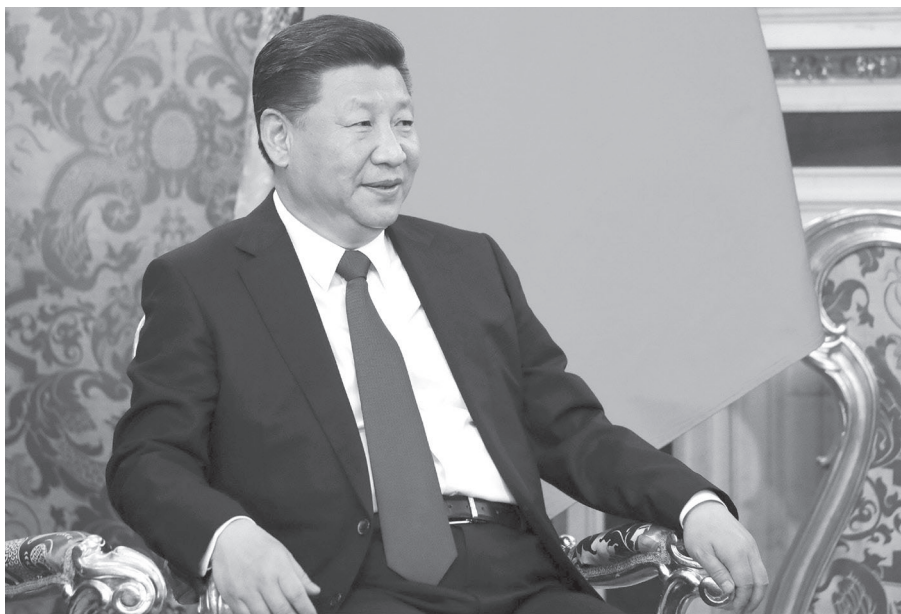
Obr. 1.1 Si Ťin-pching na setkání s Vladimírem Putinem v Moskvě, 4. červenec 2017.

Pokud by Si Ťin-pchingovu závazku před SZO odpovídala čínská zahraniční politika v průběhu pandemie, zbytek světa by se mohl oprávněně radovat z toho, že v něm nalezl v 21. století tolik potřebného světového lídra. Čínská pandemická diplomacie však není jen příběhem o zrodu nové globální mocnosti, jež bere na svá bedra odpovědnost za odpověď na bezprecedentní humanitární krizi; jedná se též o pověstného kanárka v uhelném dole – varování před případnými výzvami, jež ambice Číny a její rostoucí vliv ve světě znamenají pro současný mezinárodní systém a instituce, hodnoty a normy tvořící již bezmála 80 let jejich základy.