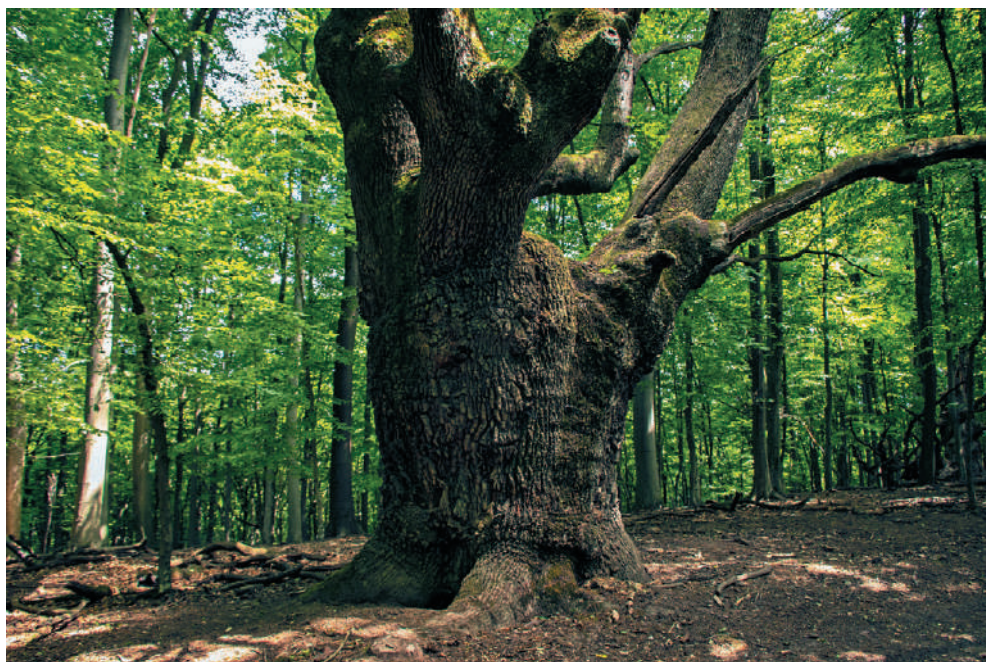
Dub letný v Lozorne

Do knihy sme vybrali finalistov uplynulých 16 ročníkov a tie sme rozdelili podľa jednotlivých krajov. Dbali sme pritom na ich proporčné zastúpenie z hľadiska druhov