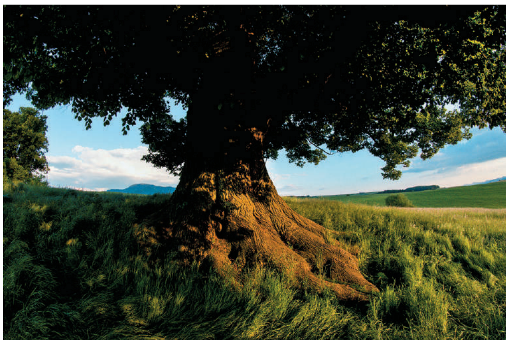
Lipa veľkolistá pri Necpaloch

Pri koncipovaní knihy, ktorú držíte v rukách, sme v spolupráci s Nadáciou Ekopolis vychádzali z jednotlivých ankiet Strom roka, ktoré sa uskutočnili v predchádzajúcich rokoch. Strom roka je celoslovenská súťaž, ktorej cieľom je upozorňovať na význam stromov v životnom prostredí a vzbudzovať a posilňovať záujem verejnosti o svoje okolie, ako aj umožniť širokej verejnosti predstaviť svoj najkrajší strom a možno aj príbeh, ktorý sa s ním spája. Vyhlásovaná je