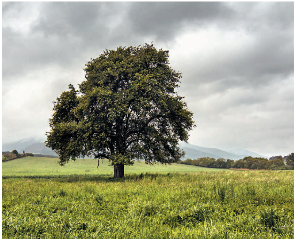
Hruška obyčajná v Laclavej

stromov a ich priestorové rozloženie. Keďže viaceré stromy sú aj symbolom jednotlivých lokalít Slovenska a patria tiež k výletným cieľom, snažili sme sa z tohto dôvodu vybrať tie, ktoré zaujmú nielen z vizuálno-estetického hľadiska či majú zaujímavé parametre, ale sa k nim viaže aj nejaký príbeh. Nie sú to len chránené stromy, ale i stromy, ktoré v posledných rokoch zaujali ľudí na Slovensku až tak, že sa stali finalistami ankety Strom roka. Myslíme si totiž, že strom nemusí mať štatút chráneného, aby zaujal človeka alebo aby mu poskytol to, čo človek v prírode hľadá. Dokonca viaceré ďalšie stromy na Slovensku by mali byť vážnymi aspirantami na tento štatút a mala by sa prehodnotiť metodika výberu, štandardizácie a ochrany stromov. Radi by sme touto publikáciou vyvolali aj diskusiu na túto tému a budeme vďační za všetky ohlasy.