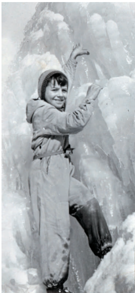
Prvé lezecké pokusy

ci na západ. Ani nie do hodiny, okolo desiatej večer sa objavila dlhá nákladná súprava, ktorá zabrzdila na červenú. Vliezli sme do brzdárskej budky. Vlak chvíľu šiel, potom stál, zase sa pohol. Vagóny drnčali, škrípali, hrmtali. Keď súprava okolo druhej opäť zabrzdila, ani jeden z nás netušil, kde sme. Hádali sme, ktorým smerom sa pohneme a čo bude ďalej, keď nás začuli železničiari prechádzajúci okolo. Možno v domnienke, že sme väzni na úteku, bežali po posily a po chvíľu pretahovania sa za kľučku na dverách vrazili do našej skrýše. Našli dvoch vyplašených výrastkov. „Ideme vlakom,“ odpovedali sme na otázku, čo tam robíme. Keď videli, že sme neškodní, dovolili nám zmiznúť bez ďalších zbytočných problémov, ktoré sme si mohli vyrobiť. V centre mesta sme si ľahli na lavičky a zaspali. O šiestej nami potriasal policajt, aby nás zobudil, kým sa v uliciach Žiliny začne bežný život. Postavili sme sa k ceste a mávali na