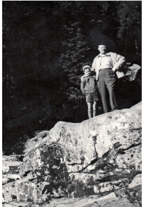
Prvé túry s otcom