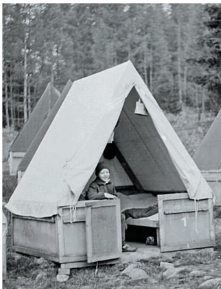
Stanový tábor na Jakubkovej lúke v Smokovci

Po nociach som prestupoval z jedného nákladného vlaku na druhý. Niekedy jazda trvala hodinu, niekedy celú noc. Trmácal som sa, nikdy nevediac, koľko kilometrov prejdem a kam sa dostanem. Vlak pribrzdil a vtedy som zahliadol nadpis stanice „Devínska Nová Ves“. Vyskočil som za jazdy v obave, že smeruje cez hranice do Rakúska. Našťastie, nič sa mi nestalo. Ďalším vlakom som prešiel cez Bratislavu a ráno sa zobudil uprostred rozsiahlej roviny. Namiesto v Tatrách ocitol som sa blízko Štúrova. Na druhý deň som na trase Zvolen – Banská Bystrica – Vrútky cestoval v otvorenom vagóne. Železničná trať sa plazí horami a nespočetnými tunelmi. Hoci sa v nich odrážal hukot vlaku a neustále kvapkala voda, za odmenu ma obklopovali lesy a príroda. Vo Vrútkach to už bolo naozaj jednoduché. Vedel som, že vlaky, ktoré smerujú na východ, ma musia doviezť domov. Posledné kilometre som strávil zalezený vo veľkej rúre s priemerom asi meter, v jej útrobach som bol chránený pred dažďom.