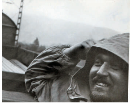
Cestovanie s kamarátom na nákladnom vlaku

okupácie, popísal som Starý Smokovec protiruskými a protiokupantskými heslami. Štátna bezpečnosť nadobudla silu a písanie hesiel mohlo viesť do kriminálu. V Prahe a ďalších veľkých mestách šli preventívne na týždeň do väzenia ľudia, ktorí mohli protest proti okupácii na jej prvé výročie vyjadriť demonštráciami. Našli sa takí, čo spálili ruskú vlajku, tí šli sedieť natvrdo. Po Starom Smokovci som vypisoval „Rusi, Rusi, to slovo sa mi hnuší“ či „Špinavý je rudý kraj“, na cestu som nakreslil sviňu, ako ju znázorňujú deti v škôlke, a vpísal som do nej „Biľak“. To ma zatiahlo po uši do „prúseru“ ako hrom.