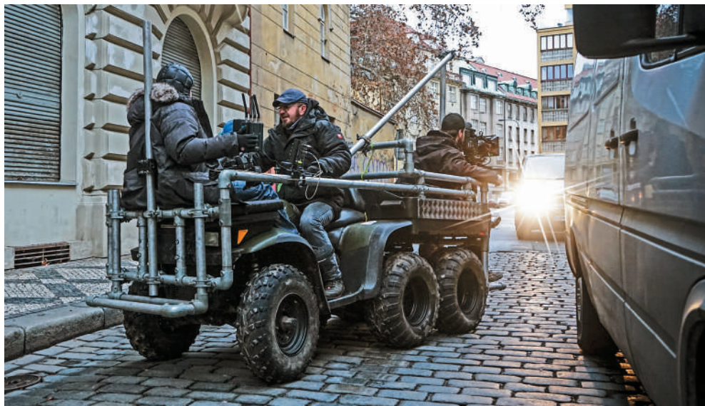
Fotografia z nakrúcania filmu Kto je ďalší? v Prahe pri bežeckých scénach

pre film dokázali v Bratislave nájsť naozaj neuveriteľné miesta.