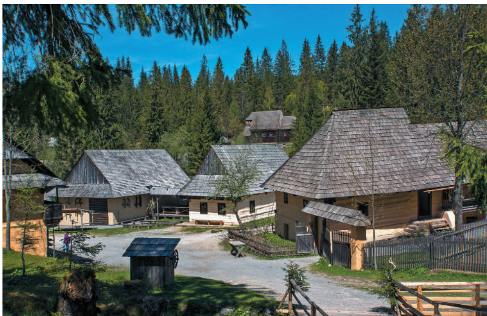
Múzeum oravskej dediny v Zuberci