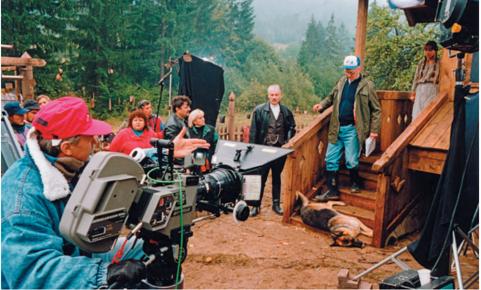
Nakrúcanie filmu Jaškov sen

Lokačný manažér či lovec filmových lokácií je práve ten človek, ktorý by mal pochopiť víziu a priniesť vhodné miesta filmovej produkcii a tvorcom. Je vyzbrojený časom, znalosťami, určitou priebornosťou a svojimi „ústami“. Mobil v ruke a poriadny fotoaparát dopĺňa aj všeobecný rozhľad a odvaha pýtať sa. Lokačný manažér hľadá nielen miesta vhodné pre film, ale pripravuje k nim aj dokumentáciu a zároveň je jeho úlohou zistiť dostupnosť miesta aj po stránke povolení, prístupnosti, prenájmu alebo povedzme, aj takého záujmu jeho majiteľov či správcov. Lokačný manažér vyhľadáva zaujímavé miesta aj bez konkrétneho dopytu. Vytvára si vlastné databázy, vďaka čomu je schopný promptnejšie reagovať na náhly záujem domácich, ale hlavne u nás dostatočne nezorientovaných zahraničných filmárov. Jeho prechádzky nemusia kopírovať turistické trasy a každé miesto vníma ako novú príležitosť. Možno žijete celý život pri celkom obyčajnej tehlovej stene so starými oknami, ktorú dosiaľ minuli sprejeri, a ani by vám nikdy nenapadlo, akým cenným môže byť takýto priestor pre film. Rovnaký