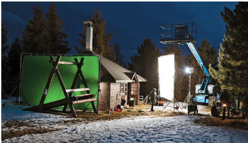
Natáčanie filmu Láska hory prenáša

na zrúcaninách slovenských hradov, v uliciach Bratislavy, v Tatrách, Slovenskom raji či na celkom nenápadných miestach, aké by sme možno minuli bez povšimnutia.