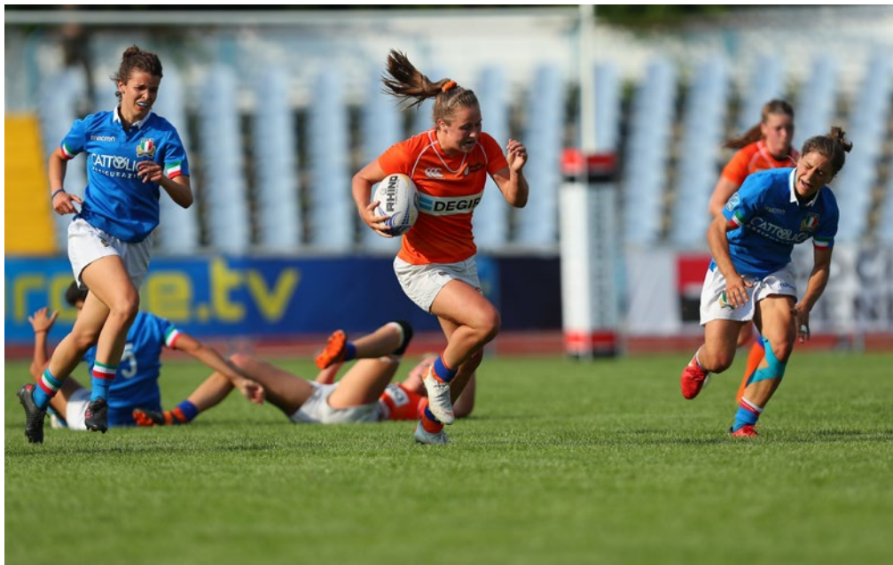
Obrázek 5 Ženské ragby