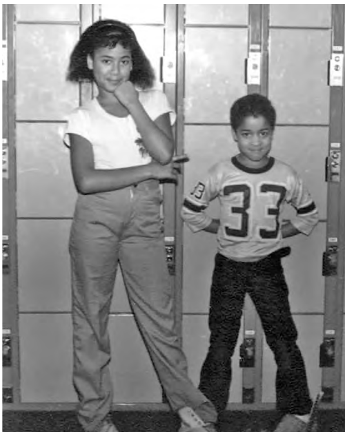
SKATELAND, JA VO VEKU ŠEŠŤ ROKOV

Okolo šiestej večer nás mama zavolala na večeru do zadnej kancelárie. Tá žena žila v neustálom popieraní, no jej materský inštinkt bol skutočný. Prejavoval sa tak, ako sa patrí, v snahe vytvoriť aspoň náznak normálnosti. Každý večer si v tej kancelárii rozložila na zem dva elektrické horáky, sadla si na päty a navarila kompletnú večeru, teda pečené mäso, zelené fazuľky a buchty, kým sa môj otec venoval účtom a telefonátom.