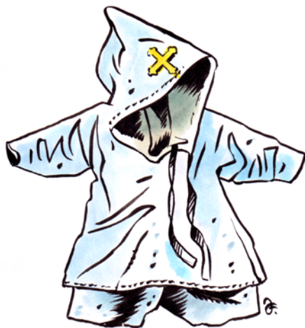
Takto vypadalo oblečení pro panovnické miminko.

Pokud nemusely svého manžela občas reprezentovat či doprovázet na cestách třeba do zahraničí, nezbylo jim než vyšívat a modlit se. Proto vítaly, když zábavy na panovnických sídlech postupně přibývalo. Od 12. století mohly třeba naslouchat pištcům, dvorním básníkům a minnesängerům, kteří oslavovali lásku a vyjadřovali úctu a obdiv k dámám. O století později se jako divačky mohly zúčastňovat turnajů, které tehdy bývaly nejoblíbenější dvorskou zábavou, a nechávaly si předčítat dvorské romány. Občas také rády usedaly do hlediště dvorských divadel, která se budovala k oslavám významných událostí v panovnické rodině (zejména korunovací) obvykle na různých místech hradčanského sídla. Později si oblíbily projížďky na koni.