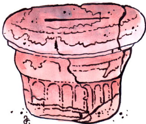
Český knížecí stolec se podle historiků nezachoval, takže musíme vzít zavděk tímto posezením korutanských Slovanů.

Druhým panovnickým hradištěm se stal asi o sto let později, tedy v 10. století, Vyšehrad .